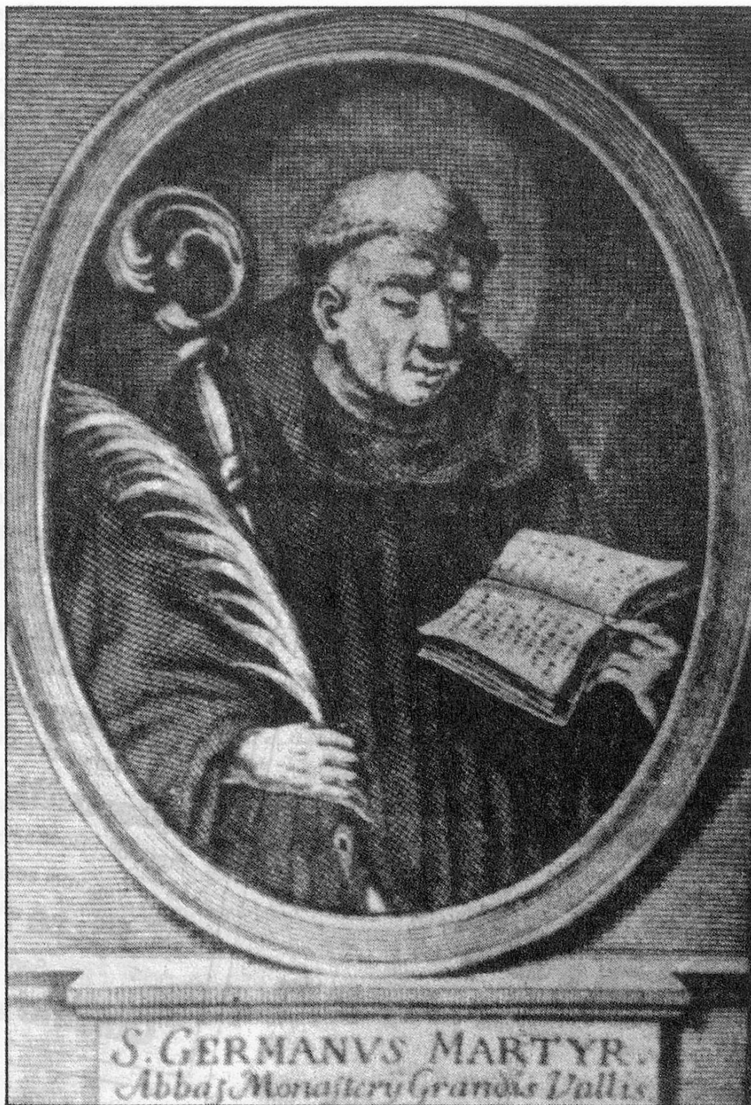
S. GERMANVS MARTYR. Abbas Monastery Grandis Vallis

Les garçons des familles Beurret et alliées portent souvent les prénoms des saints patrons vénérés dans l'ancien Evêché de Bâle, comme Imier, Ursanne et, comme ici, Germain du monastère de Moutier-Grandval.