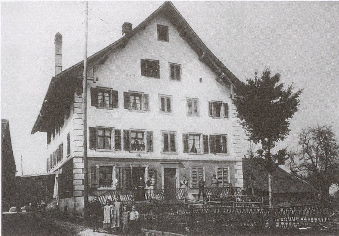
Abb. 4: Schmiedengebäude nach dem Umbau von 1920. Der eingezäunte Garten vor dem Haus, durchschnitten von einem gemeinsamen Weg (ca. 250 m 2), war in sechs Parzellen aufgeteilt, wovon jede Partei zwei, nicht nebeneinander liegende besass.