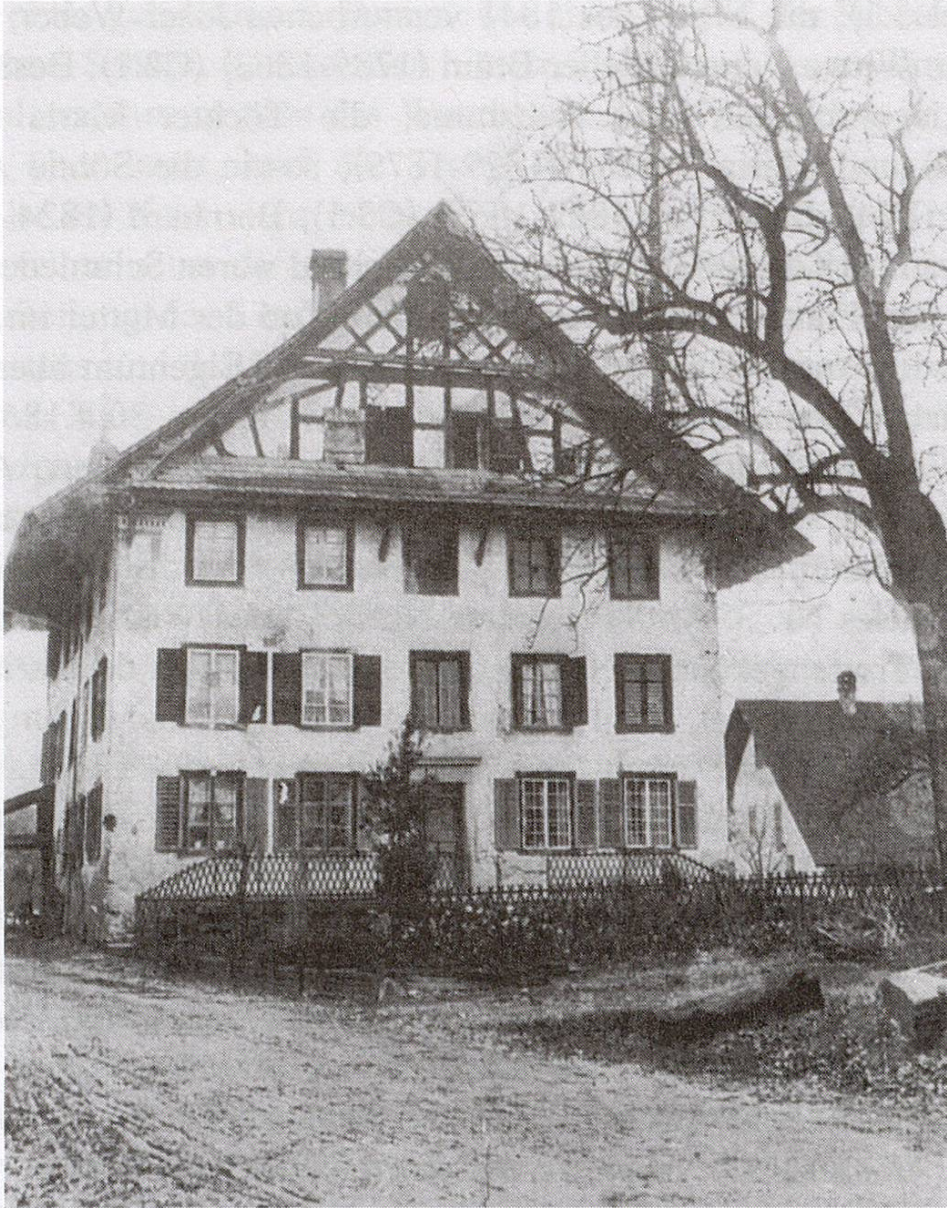
Abb. 3: Schmiedegebäude von Osten vor der Renovation von 1920, mit Fachwerkgiebel und Klebedach. An den Seiten waren Wandmalereien in Sgraffito-Technik sichtbar. Im westlichen Teil befindet sich die Schmiedewerkstatt, im östlichen (Hochparterre) die Wohnräume des Teils A. Im ersten Stock liegen gegen Osten die Wohnräume des Teils B, gegen Westen diejenigen des Teils C. Die Zimmer im zweiten Stock sind auf die einzelnen Parteien aufgeteilt. Ebenfalls aufgeteilt sind die Estrich- und Kellerräume.

wurde unter dem 28.6.1864 im Fertigungsprotokoll festgehalten (GA Sp FP 1864).