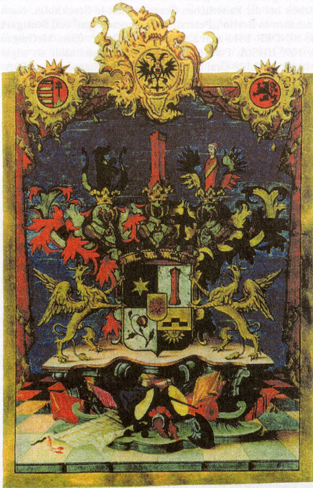
Abb. 1 Wappen der Binder von Krieglstein. Erbländischer Freiherrnstand laut Adelsdiplom von 1759 (PBK)