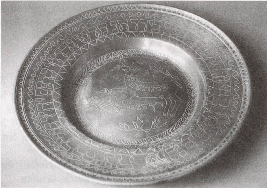
Abb. 4 Zinnteller für Hirsch = Hirtz = Naftali. Die Inschrift auf dem Teller lautet übersetzt: Renne wie ein Hirsch. Jahrzahl 1786

Mit fortschreitender Assimilation wurden auch die Vornamen angeglichen. Aus Josua wurde Georges, aus Schönele Jeannette, aus Breinle Brunetta, aus Chaim Heinrich.