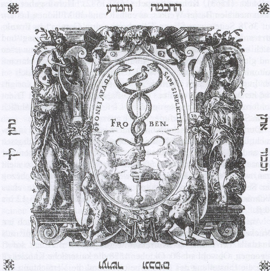
Abb. 1 Signet auf der Rückseite des Titelblattes

Reiches gekümmert, sondern sich lieber seinen Liebhabereien gewidmet habe. Dies ist ein schönes Beispiel dafür, wie die Geschichtsschreibung ein Abbild des aktuellen politischen Geschehens sein kann, hier beeinflusst vom Kulturkampf kurz vor Ausbruch des schweizerischen Sonderbundkrieges von 1844–1847.