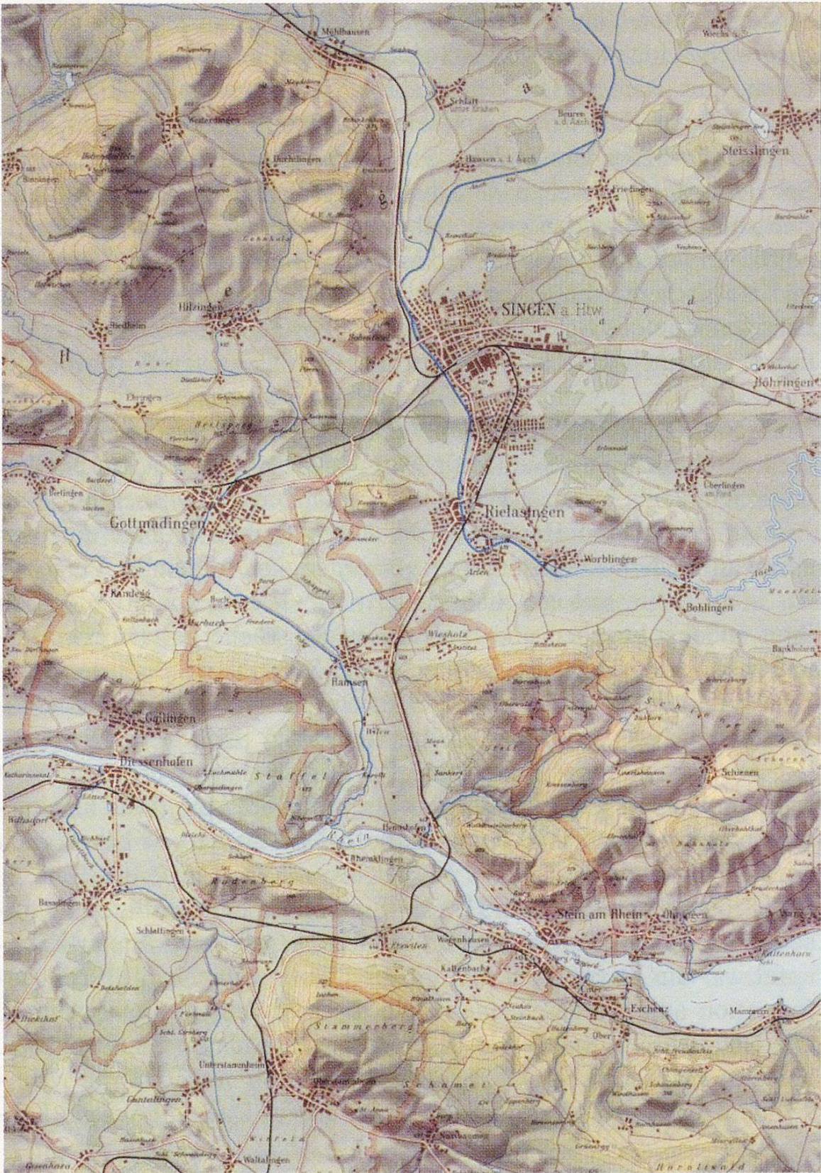
Abb. 3: Kartenausschnitt (aus: Heimatbuch Ramsen, hrsg. zur 1150-Jahr-Feier der Gemeinde Ramsen, 1996)