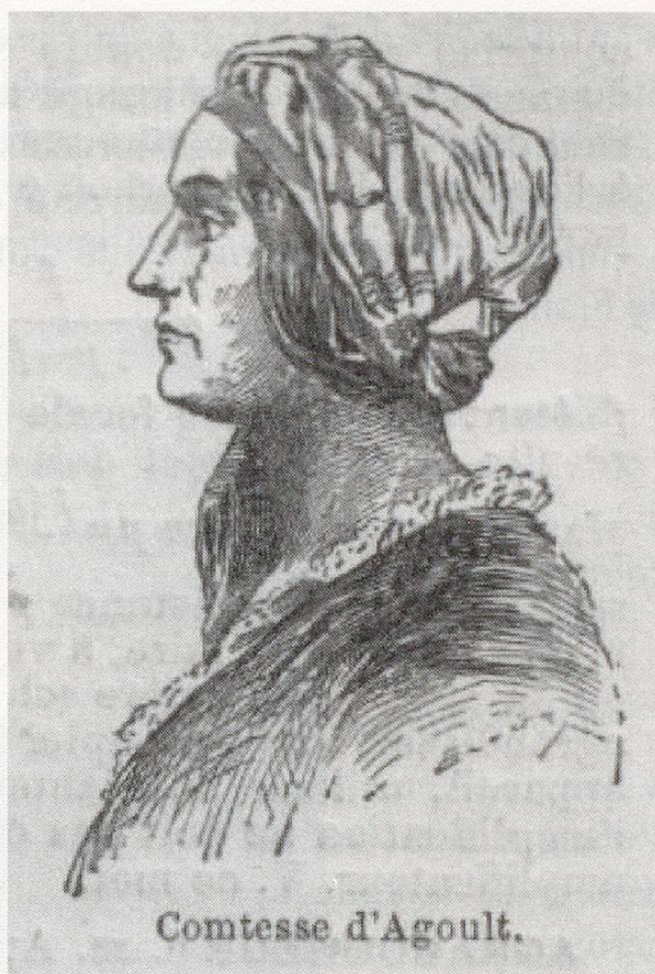
Fig. 1: Comtesse d'Agoult