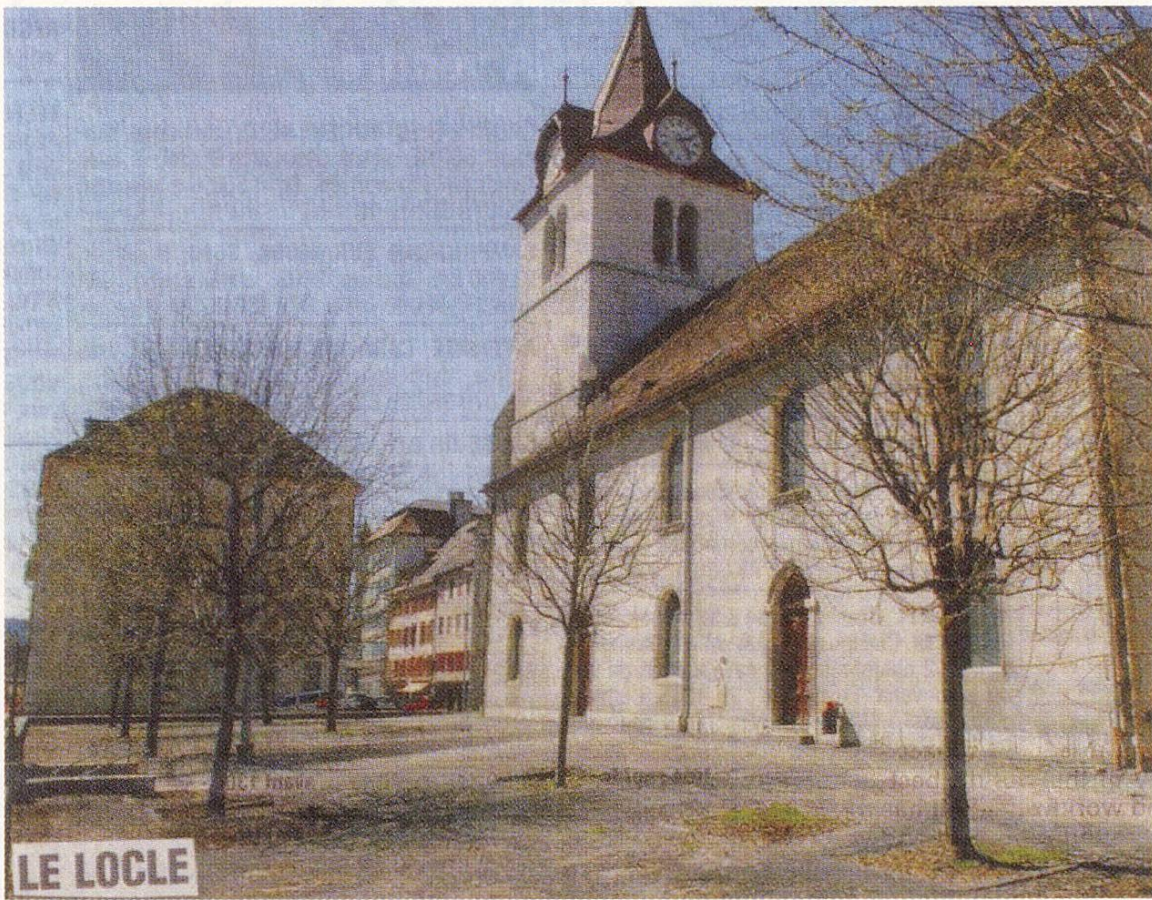
Fig. 3 Le Locle