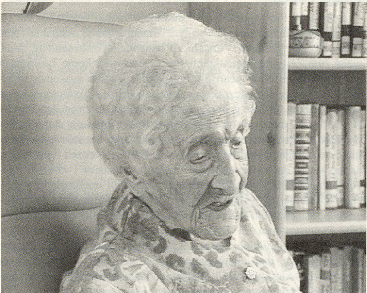
Die bisher älteste Frau der Welt, Jeanne Calment, 21.2.1875 – 4.8.1997, aus Arles, Frankreich, Alter 122 Jahre 5 Monate 14 Tage