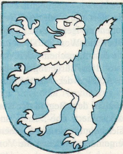
Abb. 1 Familienwappen Zingre: In Blau ein nach rechts steigen- der weisser Löwe