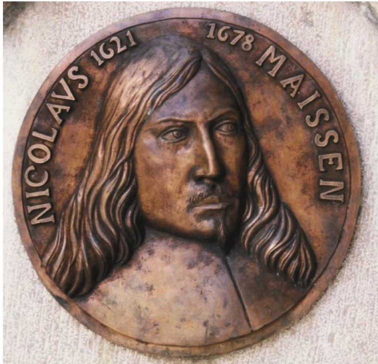
Abb. 3: Landrichter Nikolaus Maissen. Bronzeskulptur von 1978 auf einer Gedenktafel in Somvix.

der Gerichtsgemeinde Rhäzüns gefangen genommen. Sie wurden auf Schloss Rhäzüns vor Gericht gestellt, zum Tode verurteilt und Mitte Juli 1678 vom Churer Scharfrichter hingerichtet. 10