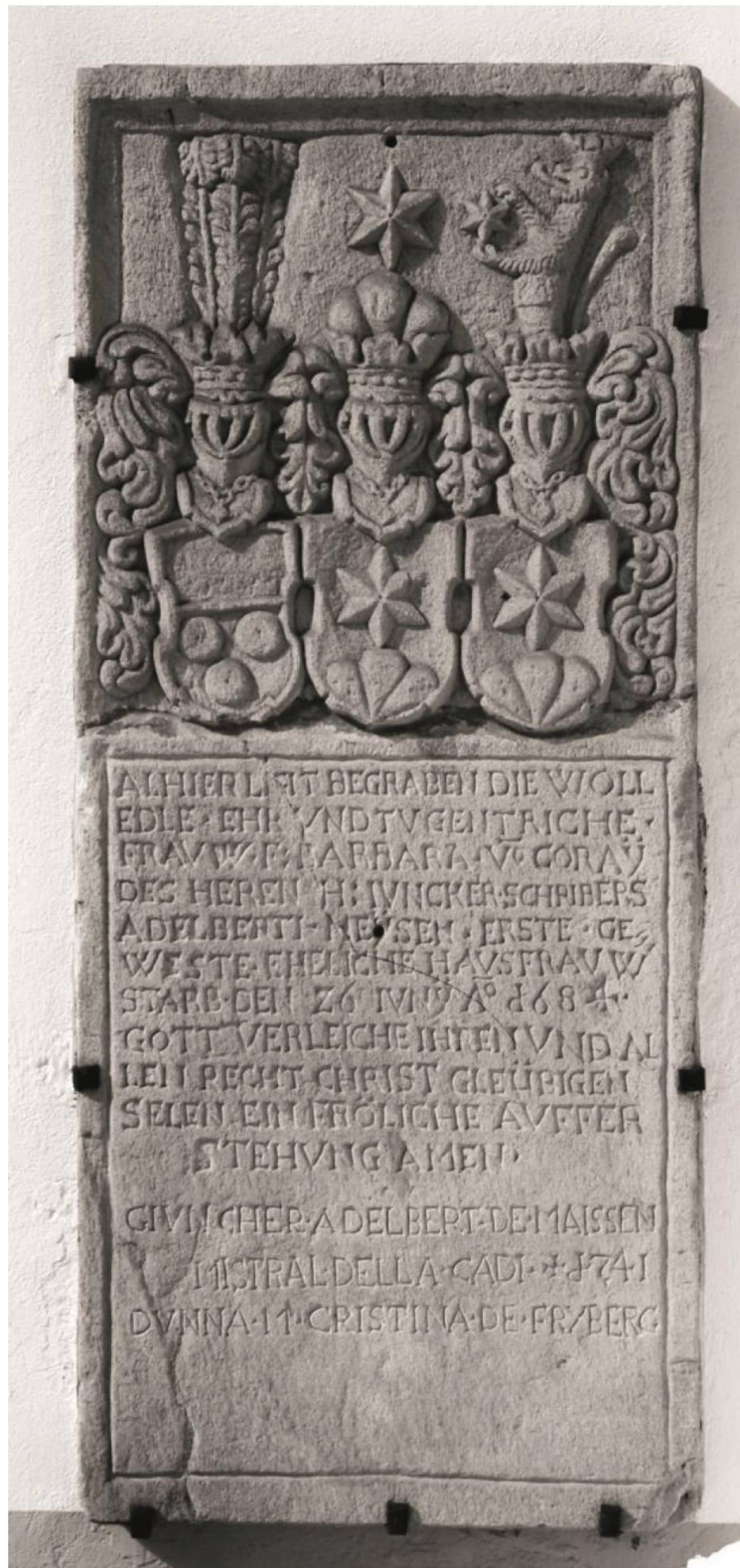
Abb. 5: Grabdenkmal mit Allianzwapen Maissen–Coray–Fryberg 26