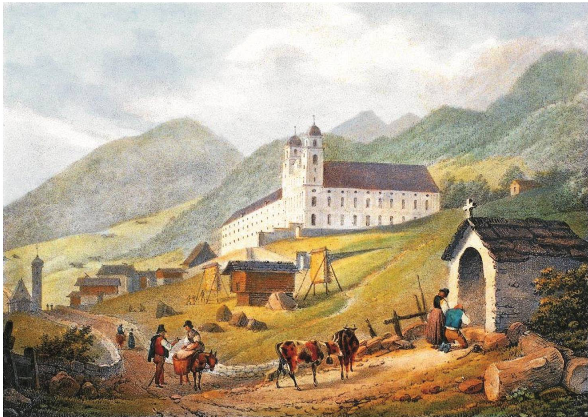
Abb. 6: Das Klosterdorf Disentis um 1827. Auf der Landsgemeinde, die vor den Klostermauern tagte, wurden der Landammann, der Säckelmeister, der Landschreiber und die Delegierten zu den Bundestag des Grauen Bundes und der Drei Bünde gewählt.