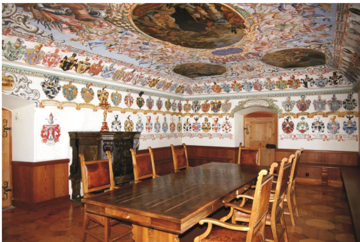
Abb. 4: Landrichtersaal in der Bundesresidenz des Grauen Bundes in Trun. Der Bundestag tagte hier an St. Jörgen (23. April) und wurde mit der Wahl des Landrichters eingeleitet. Gleichzeitig wurden der Bundesschreiber und der Bundesweibel gewählt, später der Bundesstatthalter und der Bundesoberst.