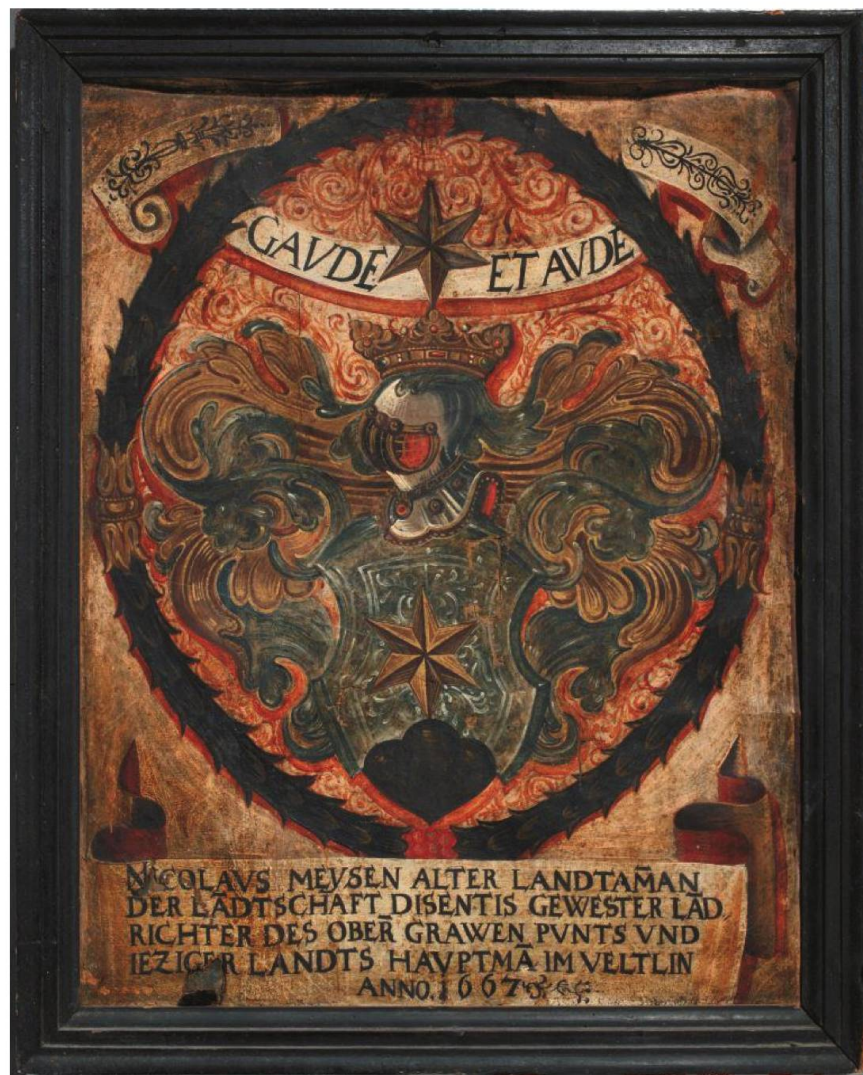
Abb. 1: Wappen Maissen im Bernischen Historischen Museum. Dieses Ölbild entstand 1667 in Sondrio und trägt folgende Inschrift:

NICOLAVS MEYSEN ALTER LANDTAMMAN DER LANDTSCHAFT DISENTIS GEWESTER LAND RICHTER DES OBER GRAWEN PVNTS VND IEZIGER LANDTS HAVPTMAN IM VELTLIN ANNO 1667