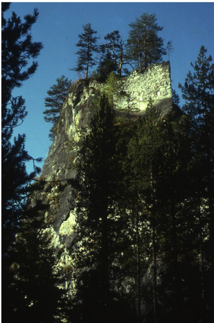
Abb. 5. Burgruine Greifenstein, Filisur GR. Der ehemalige Wohnturm aus dem 13. Jahrhundert der Burg erhob sich auf einem schmalen Felskopf. Der Zugang erfolgte über eine Treppe in einen Anbau am Fuss des Felsen.

gräfliche Familien die frühesten Träger des Burgenbaus. Ländliche und städtische Kleinadlige (Ritter, Edelknechte, Ministerialen) beteiligten sich erst vom 12. Jahrhundert an, teils selbstständig auf gerodetem Allod (freies Eigengut), teils als Vasallen und Dienstleute von landesherrlichen Machthabern auf Lehengut. In umstrittenen Grenzzonen wurden Burgen als landesherrliche Verwaltungszentren errichtet und von Vögten (Vogteien) oder Kastellanen bewohnt. Manche Burgengründungen erwiesen sich dabei als Fehlschläge, gingen rasch wieder ein oder blieben unvollendet. Durch vertragliche Teilung oder durch vorsorglichen Kauf des Baugeländes konnten Bauprojekte auch verhindert werden.