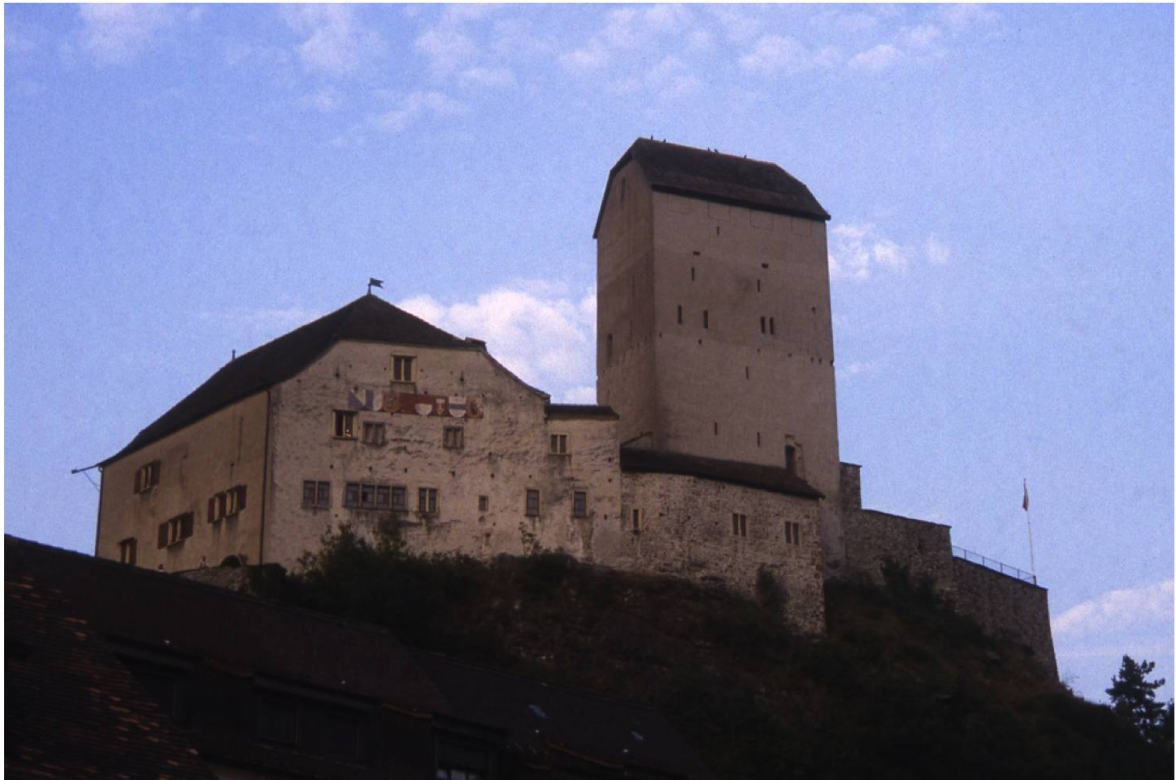
Abb. 1. Schloss Sargans SG zeigt die wichtigsten Elemente einer Burg: Turm (um 1280), Ringmauer und Palas (Wohnbau). Die mittelalterliche Burg diente 1496–1798 als Landvogteisitz. Seit bald 100 Jahren ist diese Burg vielen Schulkindern in der Schweiz als Schnittbogen-Modell bekannt.

tung (Rinder, Schweine, Schafe, Ziegen, Pferde) ausgerichtete Tätigkeit. Diese diente der Selbstversorgung und der Belieferung von nahen Märkten. In den frühen Grossanlagen entfaltete sich eine handwerkliche Produktion (u.a. Eisengewerbe), die jedoch mit dem Aufkommen der Stadt im 13. Jahrhundert verschwand.