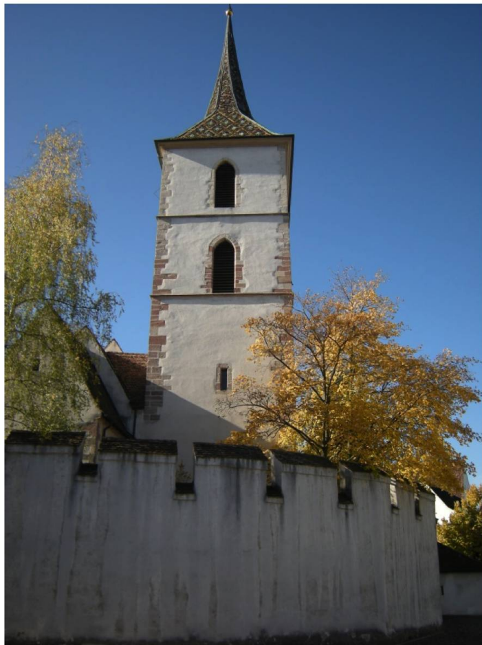
Abb. 4. Wehrkirche St. Arbobast, Muttenz BL. Die im 11. Jahrhundert gegründete Kirche umgab sich in den kriegerischen Zeiten des 15. Jahrhunderts mit einer Ringmauer mit Zinnen und Tor. Funktionell ist es eine Kirche, wird aber als Wehrkirche zu den Burgen gezählt.