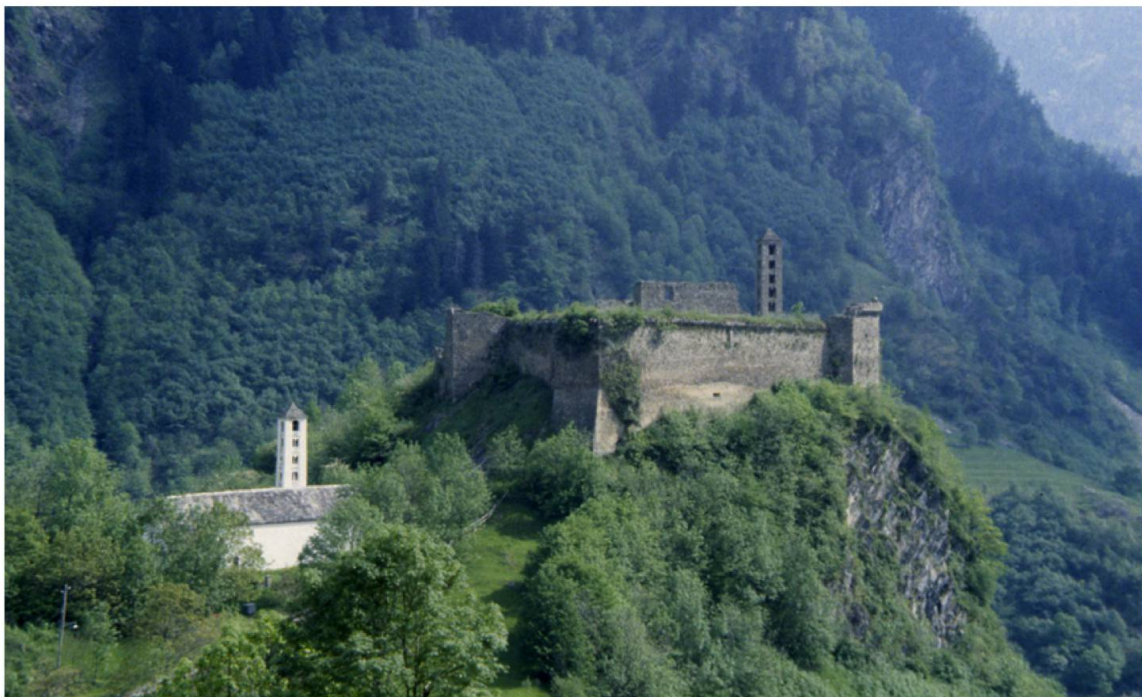
Abb. 3. Castello Mesocco GR. Auf einem mächtigen Felsriegel im Tal erhebt sich die Burg Mesocco, erbaut im 10. Jahrhundert und erweitert bis ins 14. Jahrhundert. In dieser Burg steht eine Kirche aus dem 11. Jahrhundert, die damit eine weitere Funktion einer Burg andeutet: das Kirchenkastell.

Burgkapellen als Indiz für sakrale Funktion einer Burg gab es nur auf grösseren Anlagen; teils als selbstständige Baukörper, teils integriert in die Wohnbauten. Vereinzelt erhoben sich Pfarrkirchen im Wehrbezirk grösserer Burgen. Eine Sonderrolle spielten die als Fluchtplätze für die Bevölkerung konzipierten Wehrkirchen des Spätmittelalters sowie die Niederlassungen der Ritterorden, in denen Burg- und Klosterfunktionen vereinigt waren.