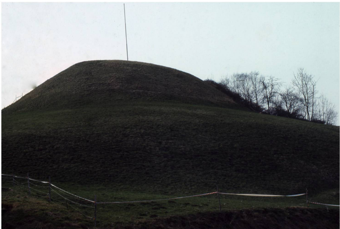
Abb. 8. Zunzger Büchel BL. Am Rande einer Talterrasse erhebt sich dieser Hügel. Im Kern verbirgt sich darin ein aufgeschütteter Hügel (Motte), auf dem einst im 10. Jahrhundert eine Burg aus Holz stand.

don). Die Verwendung grosser Findlinge (Megalithmauerwerk) findet sich vor allem im Machtbereich der Grafen von Kyburg. Das für die Stauferzeit charakteristische Buckelquader-Mauerwerk kommt vorwiegend im Molassegebiet des Schweizer Mittellandes vor (z.B. Kasteln-Alberswil, Kyburg). Backstein ist im Umfeld des Klosters St. Urban (z.B. Burgdorf) und verschiedenenorts in der Westschweiz (z.B. Vufflens) anzutreffen. Im 13. und 14. Jahrhundert erfolgten Um- und Ausbauten vornehmlich wegen der Verbesserung der Wohnqualität und des Verteidigungswerts (Flankierungs- und Tortürme, Zwinger, erhöhte Zinnen). Frühe Grossburgen wurden infolge von Funktionsbeschränkungen im Grundriss reduziert (Habsburg) oder infolge Verschiebung des Herrschaftszentrums aufgegeben (Montsalvens).