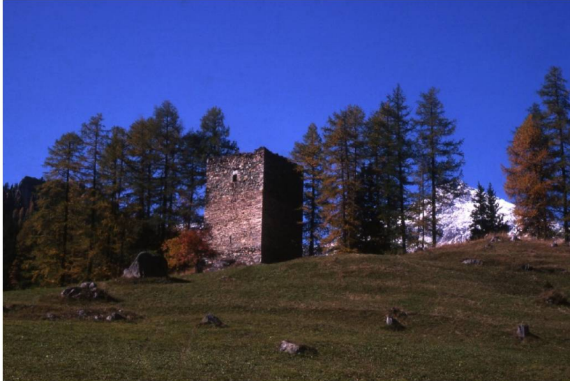
Abb. 2. Der Turm der Burgruine Spliatsch (Sur GR) erhebt sich in einer Schlaufe der Julier-Passstrasse und deutet so auf eine Funktion der Burg hin: Zoll- und Geleitrecht an einem Verkehrsweg.

Burgkapellen als Indiz für sakrale Funktion einer Burg gab es nur auf grösseren Anlagen; teils als selbstständige Baukörper, teils integriert in die Wohnbauten. Vereinzelt erhoben sich Pfarrkirchen im Wehrbezirk grösserer Burgen. Eine Sonderrolle spielten die als Fluchtplätze für die Bevölkerung konzipierten Wehrkirchen des Spätmittelalters sowie die Niederlassungen der Ritterorden, in denen Burg- und Klosterfunktionen vereinigt waren.