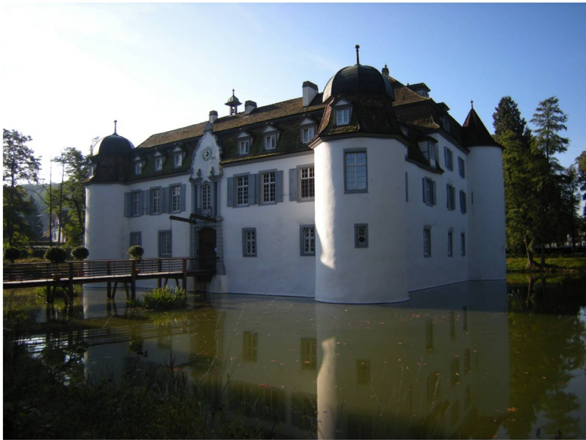
Abb. 7. Schloss Bottmingen, Bottmingen BL, schützt sich im flachen Gelände durch einen umlaufenden Wassergaben. Wenn der Graben breit und das Wasser ruhig ist, wird eine solche Anlage auch als „Weiherburg“ bezeichnet. Die ehemalige Burg aus dem 13. Jahrhundert wurde um 1720 in barockem Stil zum Schloss umgebaut.

wurde durch Steinbauten aus Mörtelmauerwerk abgelöst. In Rätien und im Tessin, vielleicht auch in der Westschweiz, hielt sich die Tradition des Steinbaues seit der Antike.