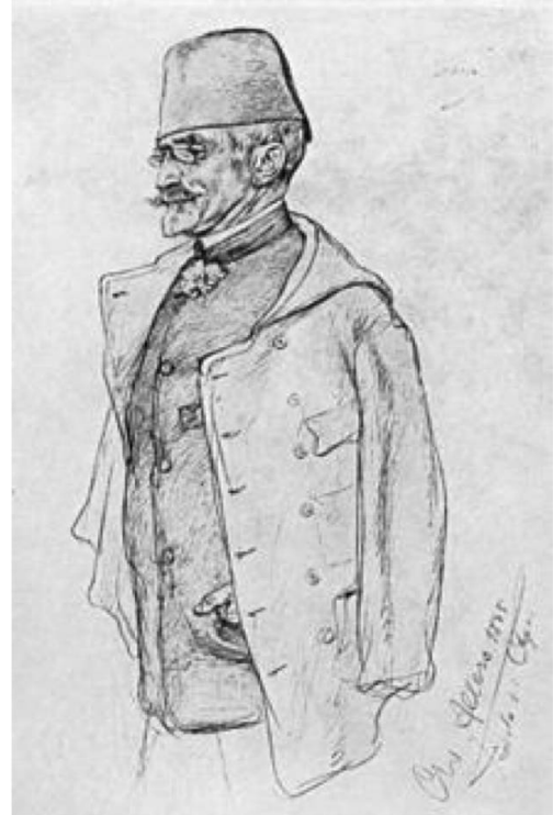
Camille du Locle

Une mention marginale ajoutée sur son acte de naissance précise que : « Ce jourd'hui 25 mars 1863 a été transcrit sur le registre des actes de naissance de ladite année sous le 118/2, un jugement rendu par le Tribunal civil de cette ville le 12 mai 1863, qui ordonne qu'en vertu du décret impérial en date du 21 février 1861 Daniel Ducommun est autorisé à ajouter à son nom celui de du Locle et à s'appeler à l'avenir Ducommun du Locle. » Cette mention est étonnante, puisque le patronyme « Ducommun du Locle » est déjà utilisé dans l'acte de 1832 et que le père signe « Ducommun du Locle ». C'est donc que le nom double était déjà employé par la famille bien avant son officialisation. C'est