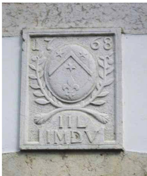
Image 2 : Cartouche de la maison Lorimier avec blason et date de construction (1768).

Celui qui traverse le village reconnaît cette majestueuse ferme du XVIII e siècle, au nord de la route, non loin du bâtiment scolaire plus tardif. Elle fut construite en 1768 par Jean-Jacques Lorimier et son épouse Jeanne-Marie née Dessoulavy, ainsi que le montre le cartouche armorié 4 surmontant les initiales du couple, au-dessus de la porte d'entrée méridionale.