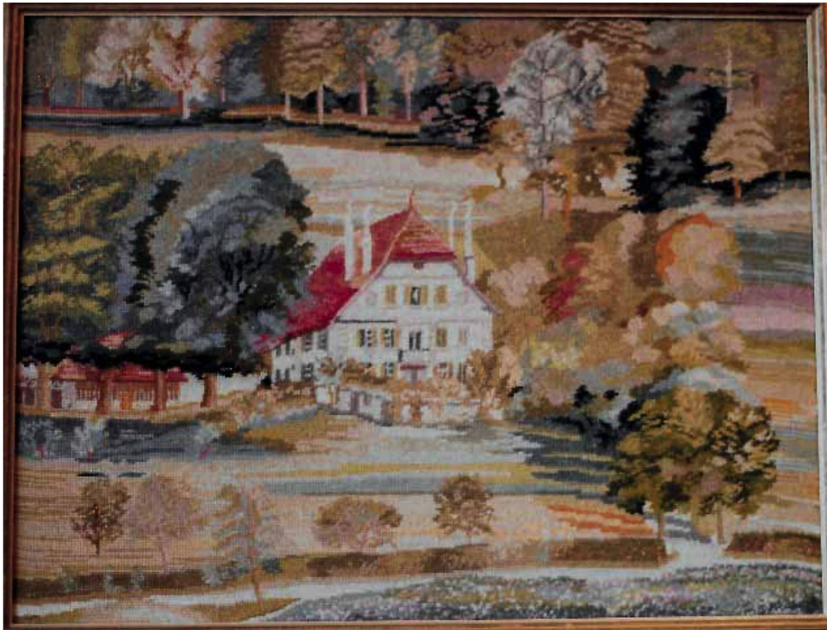
Abb. 2: «Inneres Sommerhaus» in Burgdorf