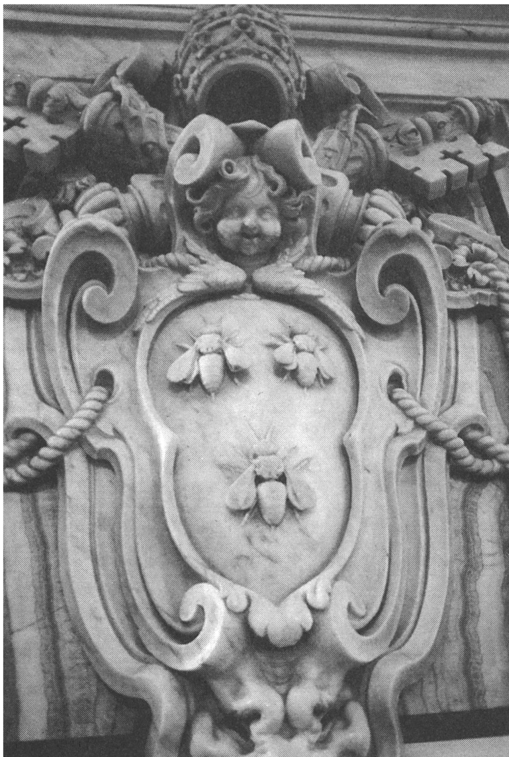
III. 2. Basilique vaticane, baldaquin du Bernin, soubassement antérieur droit