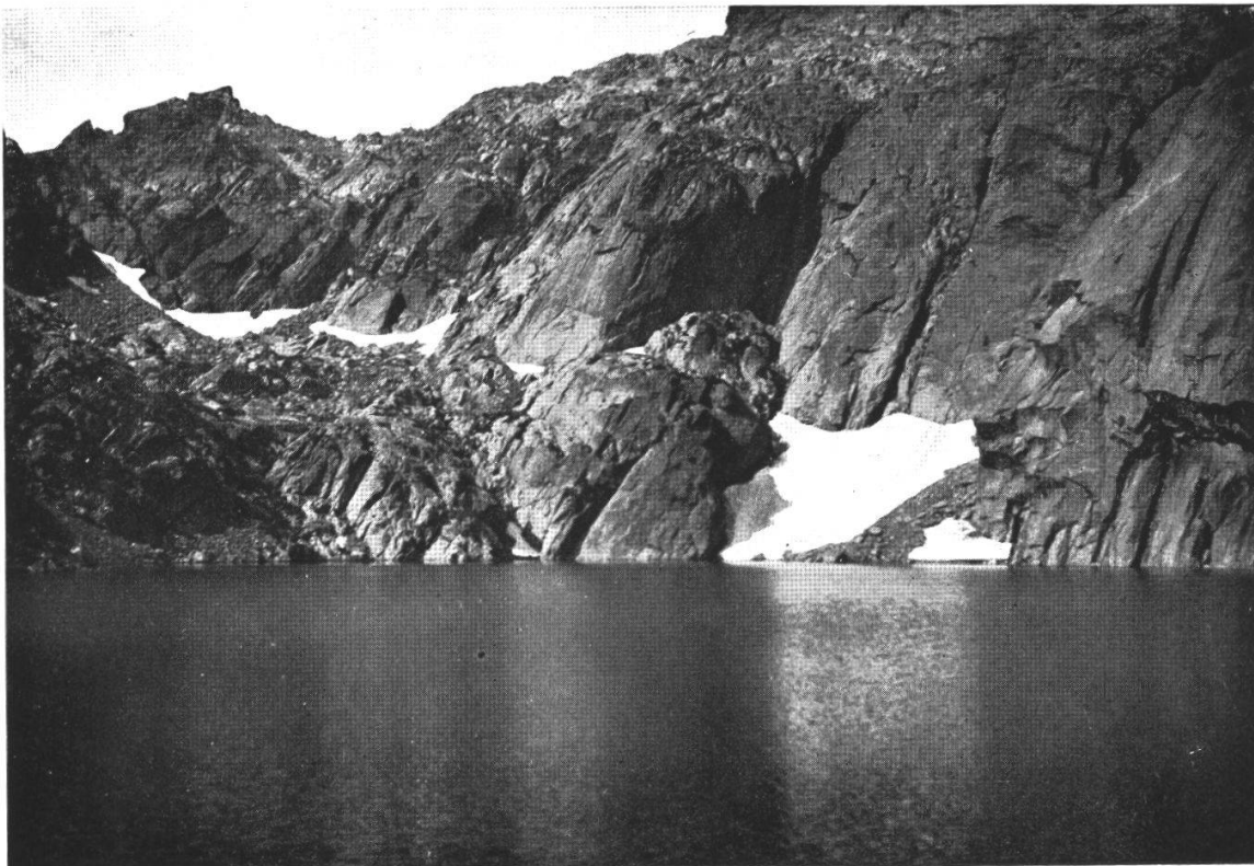
Lac de Bastani. Im Massiv des Monte Renoso, auf etwa 2200 m über Meer. Blick gegen Osten. An den Ufern Moränen. 4. VIII. 1923