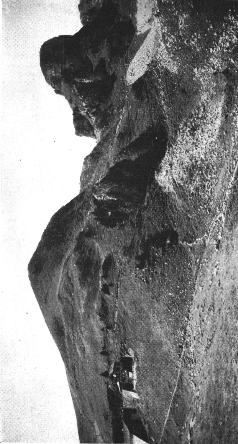
Abb. 1. Gebiet des Alpengartens Schinigeplatte von Süden gesehen. Links außen Bahnstation Schinigeplatte und Alpengartenhaus. Mitte der große Felsen im Alpengarten mit Fichtengruppe. Hinten links die Geiß, rechts das Gummihorn. Vegetation des Hanges meist Seslerieto-Sempervivretum.