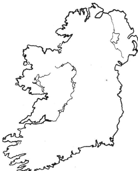
Abb. 10b. Viola Curtisii - Syntrichia ruralis -Ass. (zu Tab. 46).