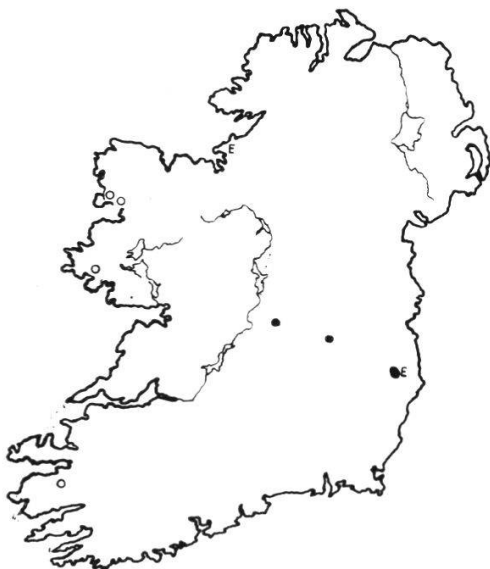
Abb. 10c. Pleurozia purpurea - Erica tetralix -Ass. (zu Tab. 48). Helle Kreise: Subass. von Molinia coerulea . Schwarze Punkte: Subass. von Andromeda polifolia . E: Subass. von Empetrum .