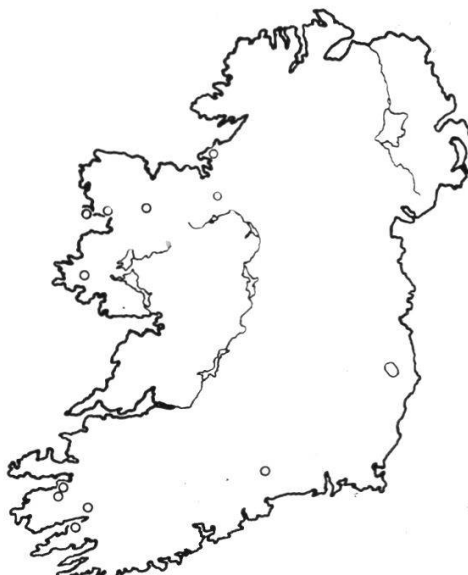
Abb. 10d. Ericeto-Caricetum binervis (zu Tab. 52 und 53).