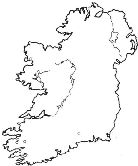
Abb. 10a. Aira praecox - Sedum anglicum -Ass. (zu Tab. 45).

3 Aufnahmen dieser Gesellschaft von Slievanea in SW-Irland (Tab. 6,3; 6,6; 8,7). Evans (1932, p. 34) teilt eine Aufnahme aus dem Co. Merioneth an der Cardian-Bay mit. Eine fragmentarische Liste von Elgee (1914) läßt endlich eine der irischen ähnliche Assoziation auch in den Eastern Moorlands von Yorkshire erwarten. Wir selbst haben diese Heide auf dem Ben Bulbin, Co. Sligo, studiert, wo sie besonders eindrucksvoll wirkt (Abb. 7, S. 347).