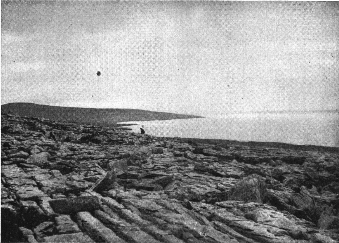
Abb. 1. Burren bei Black Head, Co. Galway: Dryas octopetala als Pionier des Asperuleto-Dryadetum auf flachliegenden, verschrundeten Karbonkalken.