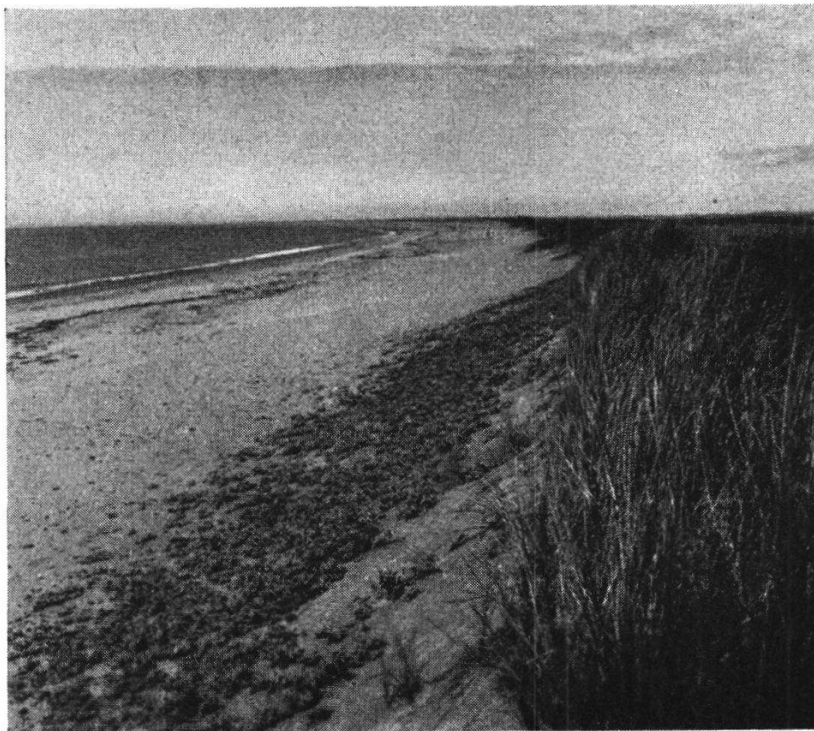
Abb. 2. Euphorbio-Agrophyretum juncei , Minuartia peploides -Fazies vor Ammophiletum bei Wexford.