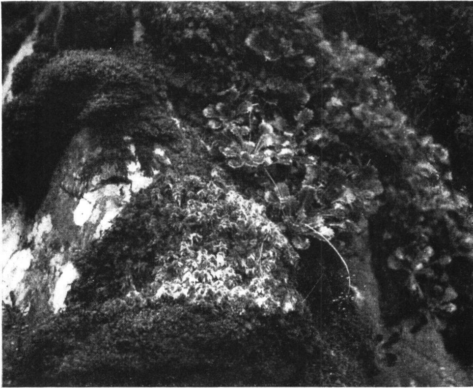
Abb. 1. Upper Lake von Killarney: Saxifraga spathularis , Hymenophyllum tunbrigense und peltatum , Sphagnum sp. im Hymenophylletum des Derrycunihy-Wood.