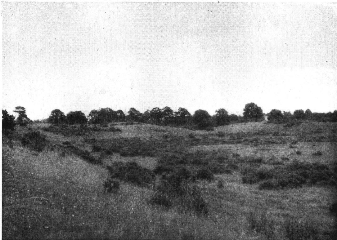
Abb. 2. Esker bei Nurney, Co. Offaly. Eindringen der Ulex -Heide in den Trockenrasen des Antennarietum hibernicae .