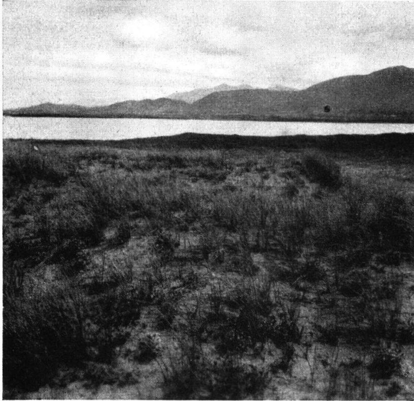
Abb. 1. Euphorbio-Ammophiletum auf der Nehrung bei Glenbeigh, Co. Kerry.