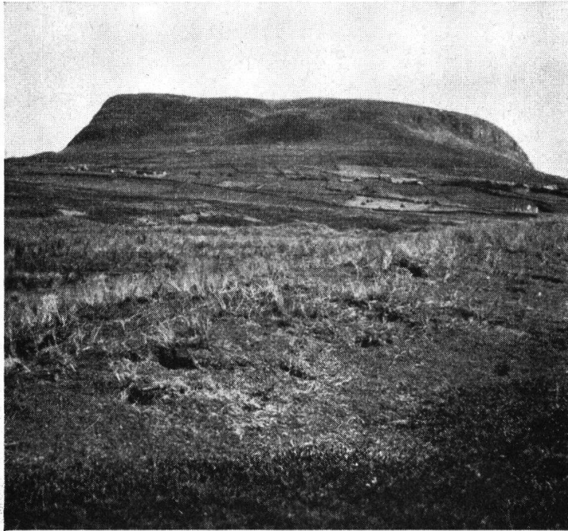
Abb. 1. Viola Curtisii - Syntrichia ruralis -Ass. am Knock-Area, Co. Sligo.