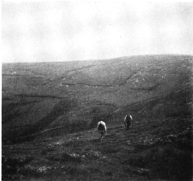
Abb. 2. Am Abstieg vom Ben Bulbin, Co. Sligo. Deckenmoore.