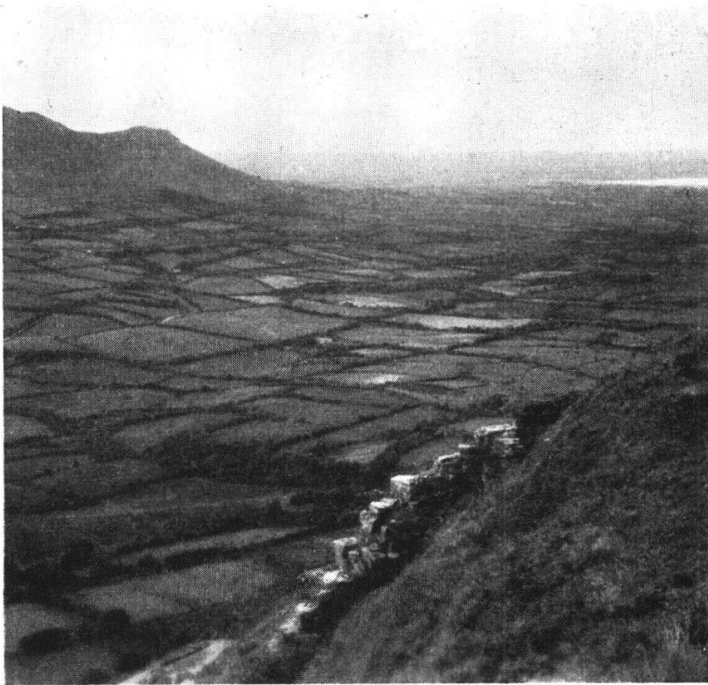
Abb. 2. Blick auf die Heckenlandschaft vom Ben Bulbin nach SW.