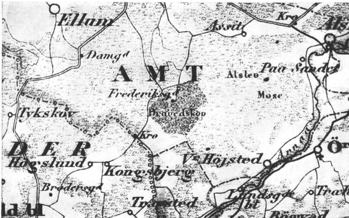
Fig. 1. Der Wald Draved und die umgebenden Moore. Vergrößerter Ausschnitt von der Karte des dänischen Generalstabes 1860. Maßstab 1:120 000. Der Hof Frederiksgaard wurde 1787 errichtet.

Im südwestlichen Jütland liegt in einem Altmoränengebiet der Wald Draved, an allen Seiten von großen Mooren und nassen Heiden umgeben, bis vor kurzem noch sehr entlegen und recht unzugänglich (Fig. 1).