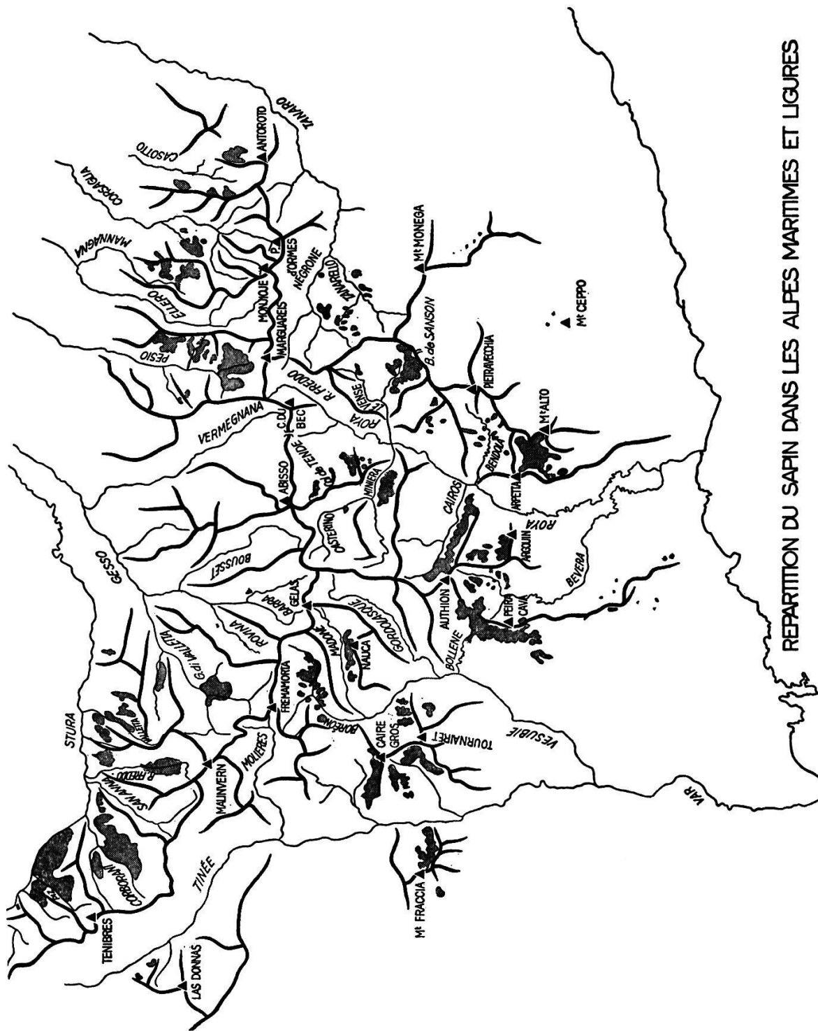
REPARTITION DU SAPIN DANS LES ALPES MARITIMES ET LIGURES

(Alpes vénitiennes, Péninsule nord-balkanique) se rencontrent des sapinières pures ou des hêtraies-sapinières qui couvrent de très vastes superficies (WRABER [1955, 1959], HORVAT [1938–1950], OBERDORFER [1957, 1962], SOO [1964], AICHINGER [1933]).