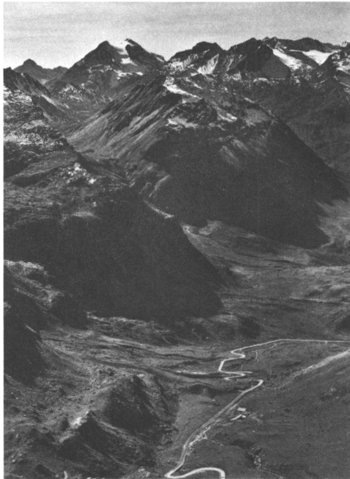
Photo 14 Alp Gügli oberhalb Silvaplana. Längs des Bachlaufs (2100–2200 m) Flachmoorkomplex mit Kobresietum simpliciusculae (Aufn. 37) und Caricion fuscae