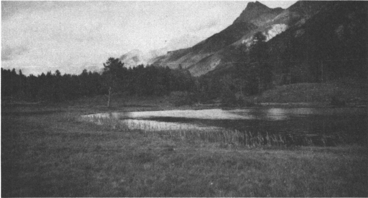
Photo 1 Caricetum limosae (am Seeufer) und Caricetum fuscae am Lai Nair bei Tarasp 1544 m