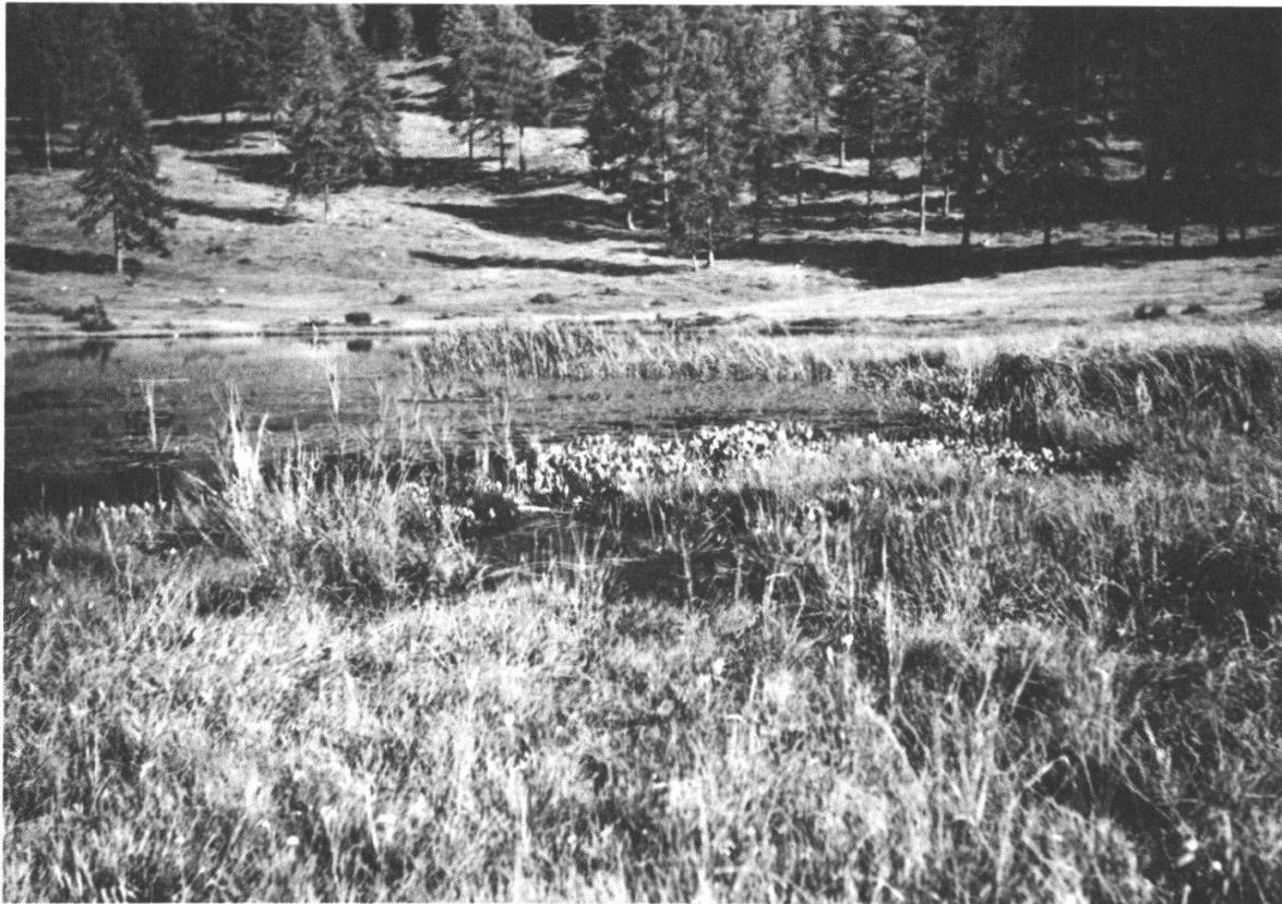
Photo 2 Verlandung am Lai Nair bei Tarasp. Im Wasser Carex rostrata -Bestand mit Menyanthes trifoliata , umrandet vom Caricetum limosae , dem das Caricetum fuscae nachfolgt