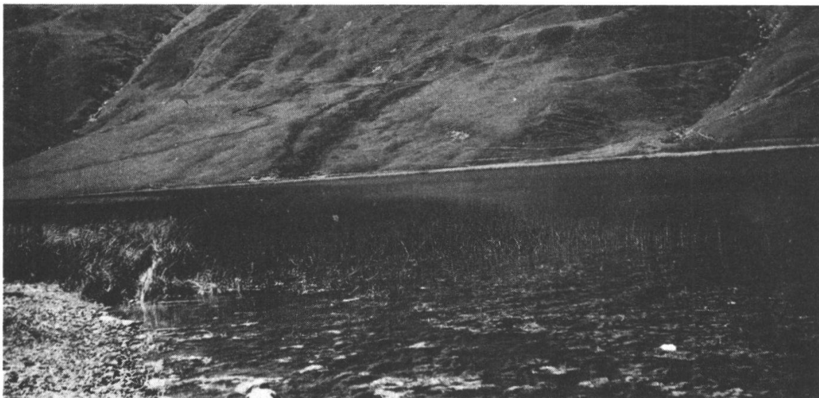
Photo 6 Lago di Maddalena an den Quellen der Stura 1980 m. Carex rostrata -Bestand mit Equisetum fluviatile als Verlander. Vorn Potametum alpini