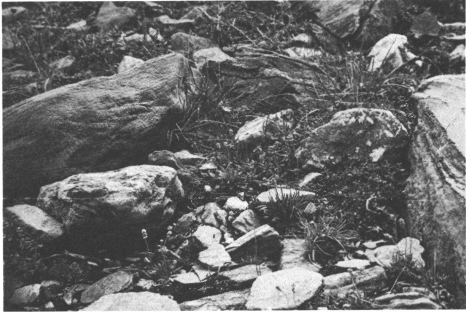
Photo 13 Kobresietum -Fragment mit Tofieldia palustris im inneren Samnaun