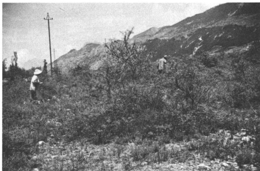
Photo 10 Vorrücken des Sanddorngebüsches auf Durance-Geschiebe bei Saint-Clément (900 m)