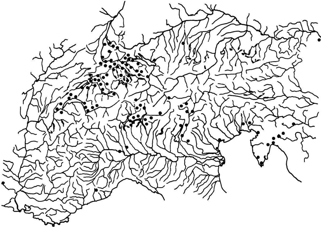
Abb. 22 Die Verbreitung der Campanula Rapunculus im Bereich der Alpen, sowie im nördlichen und südlichen Alpenvorland