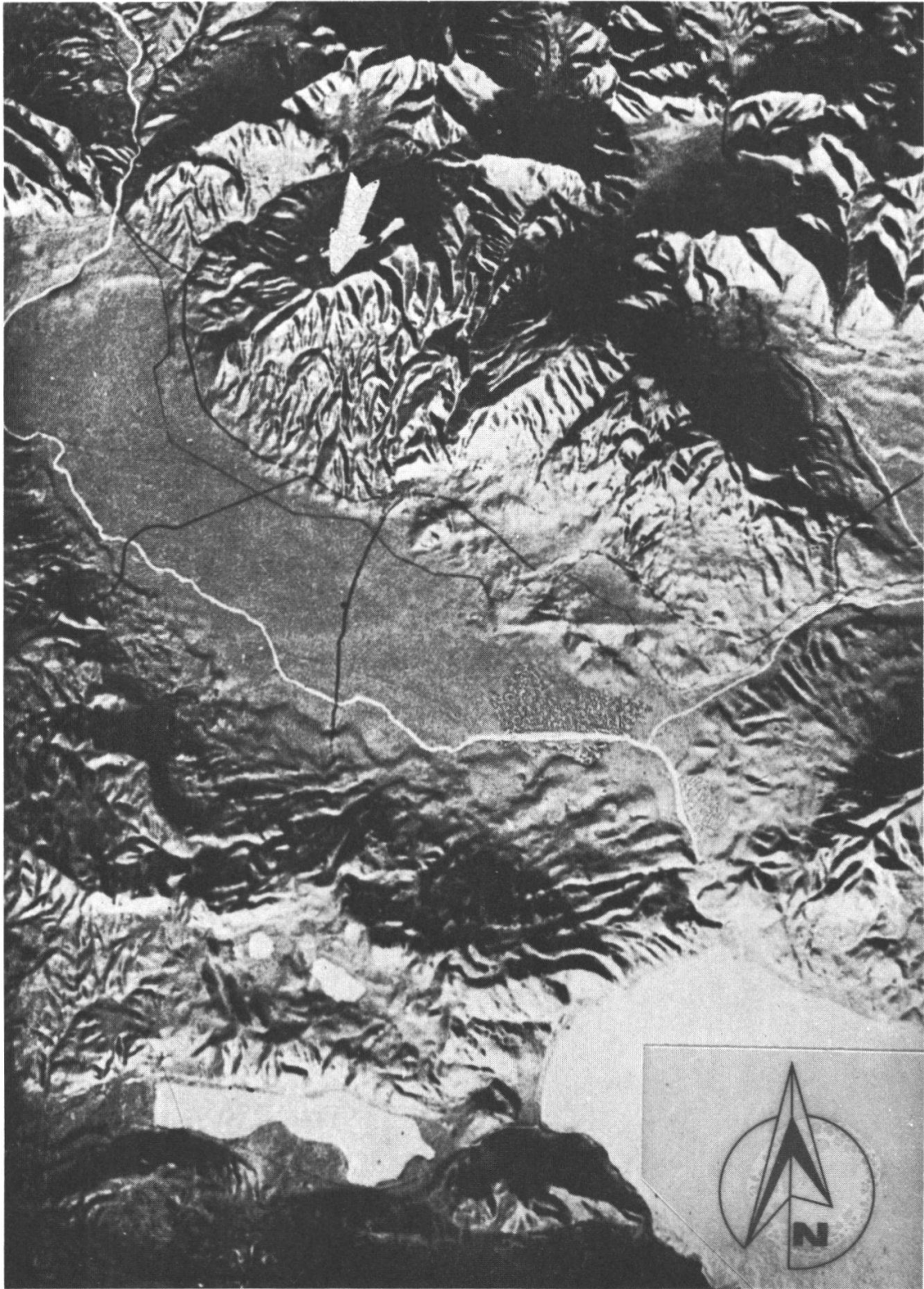
Reliefkarte eines Teiles von Zentral- und Ostmazedonien mit Lailias-Gebirge.