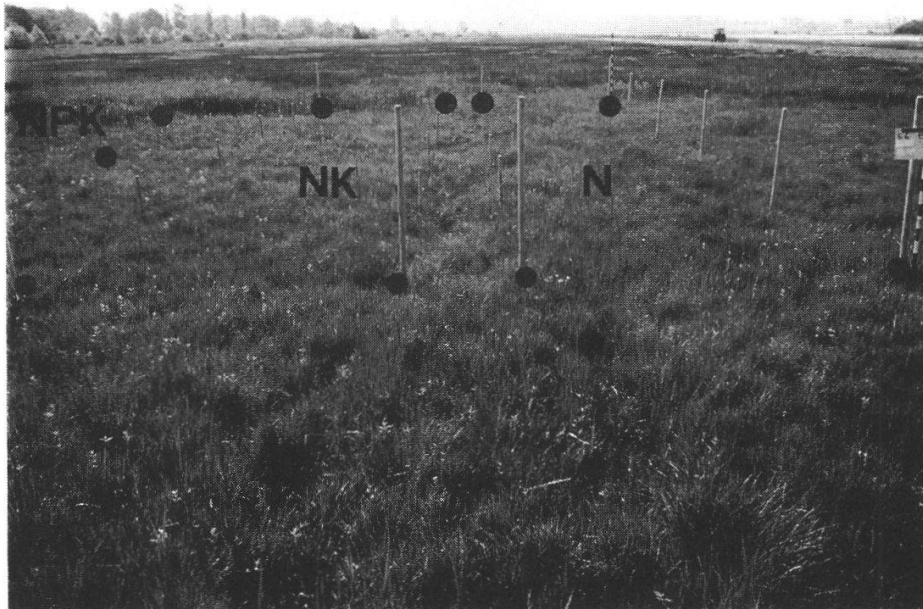
Abb. 6. Klotener Dungungsflache (N, NK, NPK: s. Abb. 7)

Da die Nullaufnahme verunmoglicht wurde (s. Kap. 3.4.1.), machte ich mir Ende September Notizen uber die auffalligen Arten (z.B. Calamagrostis ) und zum Zweitaufwuchs.