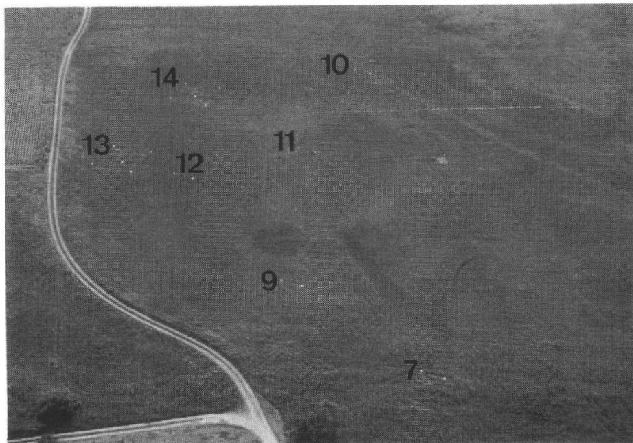
A Luftaufnahme der Lunnerallmend mit den durch Nummern bezeichneten Düngungs- (13, 14) und Kontrollflächen (7, 9-12) vom 16. Juli 1979

Der linke Teil der Tabelle 3 gibt eine Uebersicht über die durchgeführten Erhebungen. Nach Beendigung der Eutrophierungssimulation wurden die Volldüngungsparzellen zu Testflächen eines Regenerationsexperimentes (siehe Kap. 3.2.). Da weitere Bestandesveränderungen erwartet werden konnten (EGLOFF 1983), wurden die ehemaligen PK-Parzellen weiterhin beobachtet.