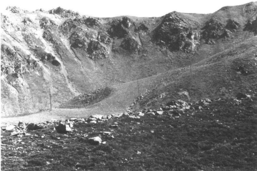
Fig.4. Halbstabilisierte Schutthalde und planierte Skipiste auf dem Jakobshorn. Half-stabilized scree slope and graded ski run at Jakobshorn.