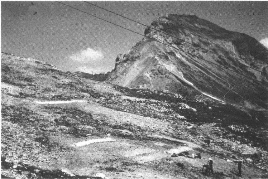
Fig.3. Planierte Skipiste auf der Strela. Graded ski run at Strela.