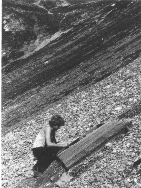
Fig.2. Aktive und halbstabilisierte Schutthalde am Schiawang. Active and half-stabilized scree slope at Schiawang.

abfahrt und auf der Clavadeler Alp wurden wiederholt kommerziell begrünt, allerdings mit wenig Erfolg (MEISTERHANS 1977).