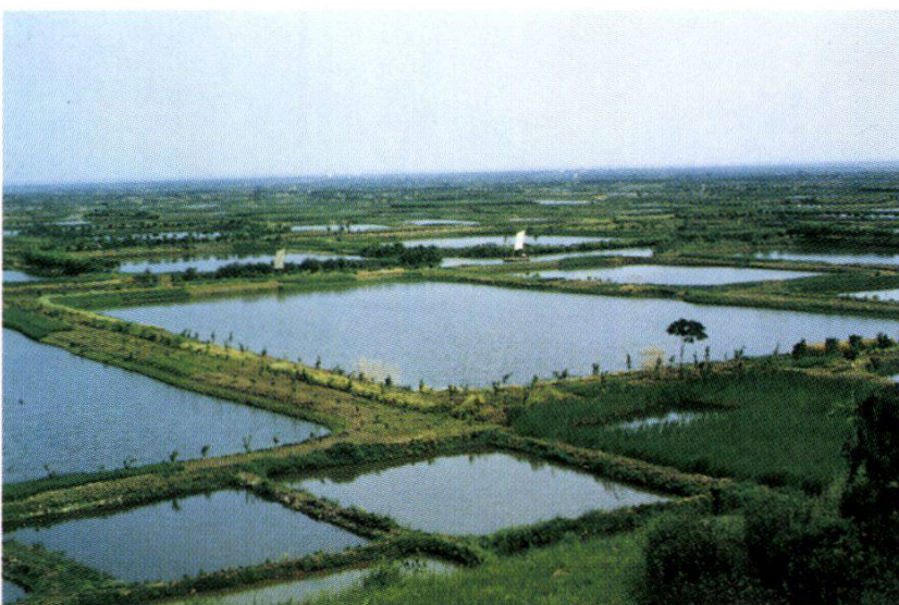
9. Integrated agriculture-aquaculture system