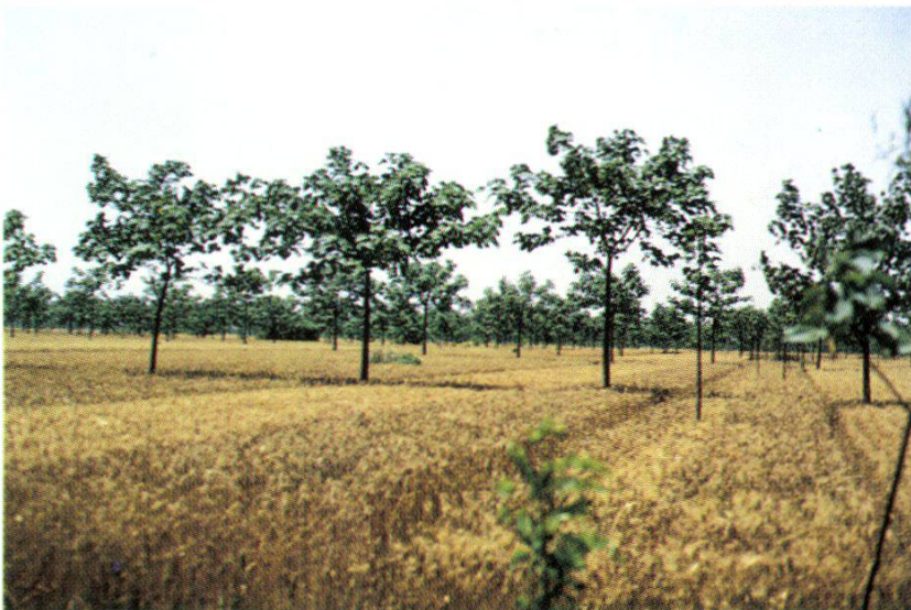
2. Paulownia cereal crops intercropping