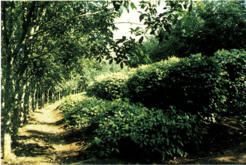
7. Rubber + pepper system