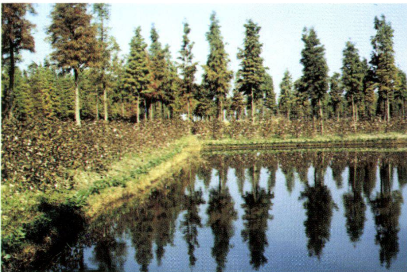
3. Swamp cypress + crop + fishery system