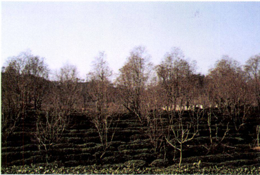
4. Sapium + tea system