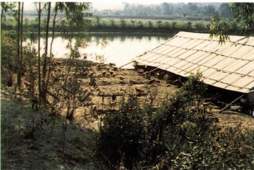
6. Eucalyptus + tea system