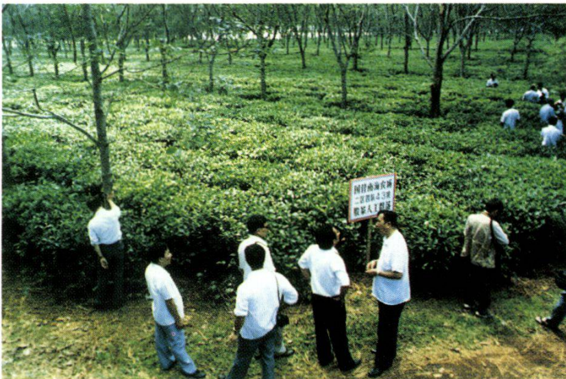
8. Rubber + tea system