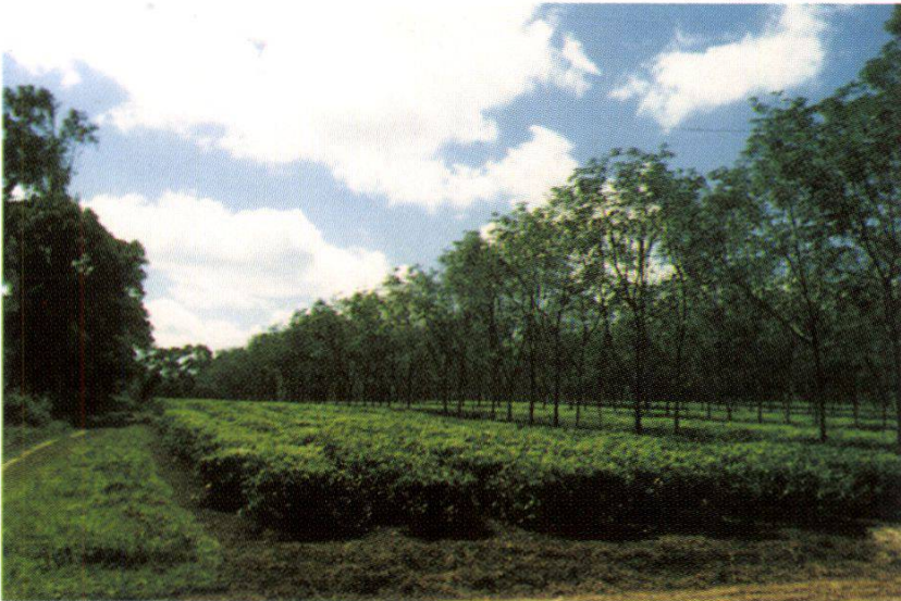
5. Poultry + aquaculture system