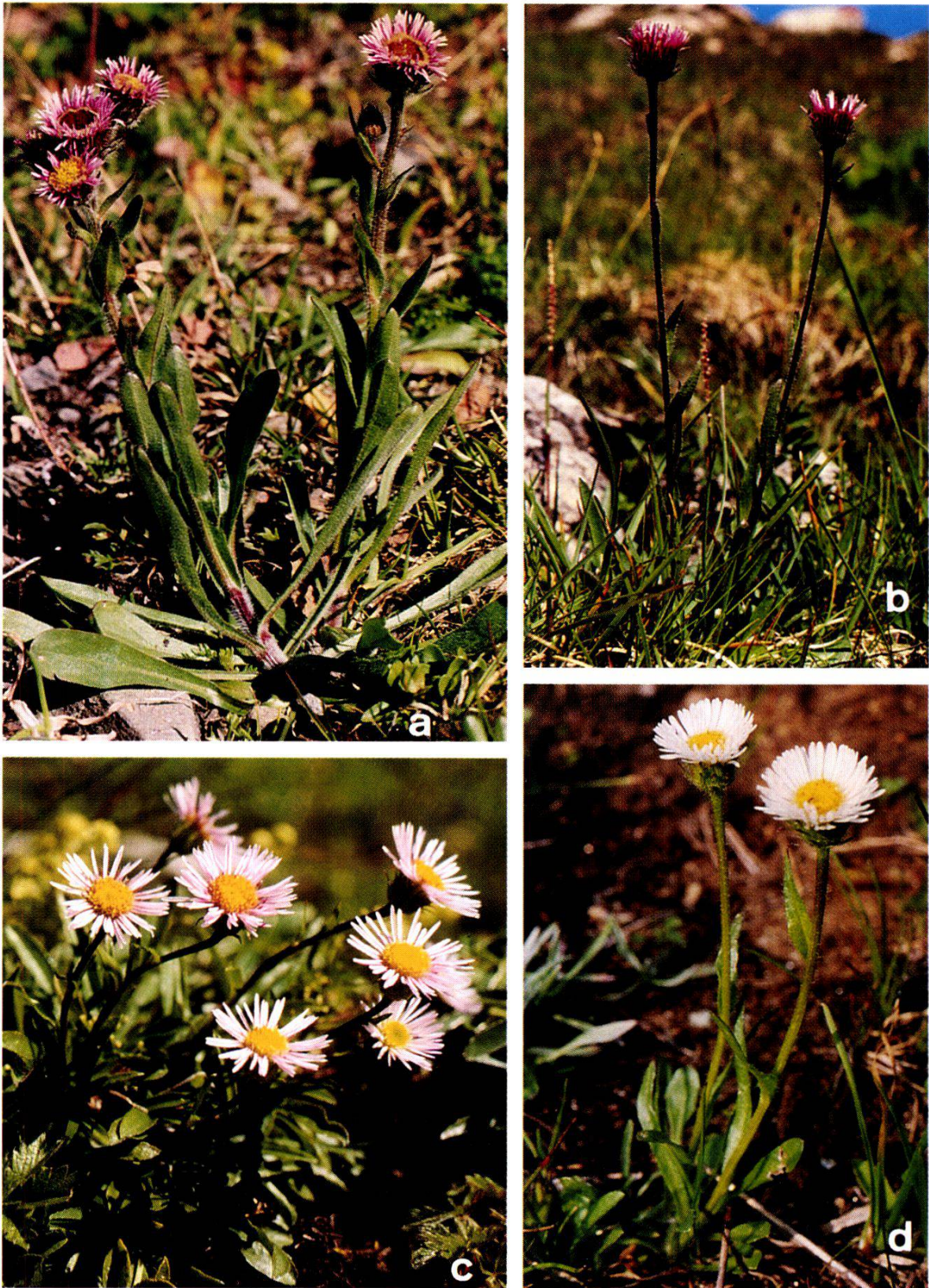
Fig. 2. Habitus der Erigeron -Arten der Alpen, I. - Habit of the Erigeron species of the Alps, I. a) E. alpinus (Arosa, Nr. 203, Kap. 2), b) E. neglectus (Piz Padella, Nr. 39), c) E. glabratus subsp. glabratus (Melchsee-Frutt, Nr. 27), d) E. glabratus subsp. candidus (Koralpe, Nr. 89).