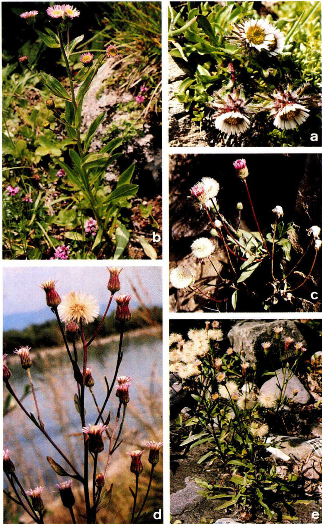
Fig. 3. Habitus der Erigeron -Arten der Alpen, II. - Habit of the Erigeron species of the Alps, II.

a) E. uniflorus (Rinsennock, Nr. 97, Kap. 2), b) E. atticus (Koralpe, Nr. 91), c) E. gaudinii (Zernež, Nr. 45), d) E. acer (Diepoldsau, Nr. 152), e) E. angulosus (Linthal, Nr. 154).