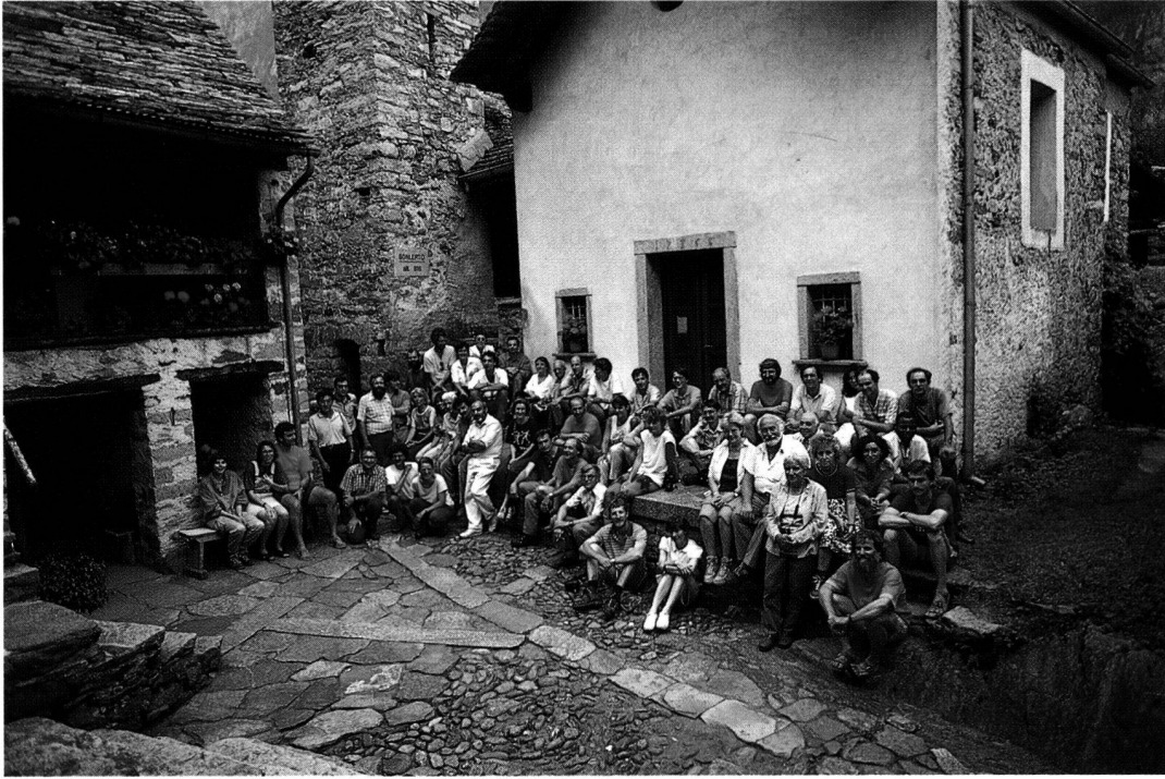
Les participants de l'excursion à Foroglio (Tessin)