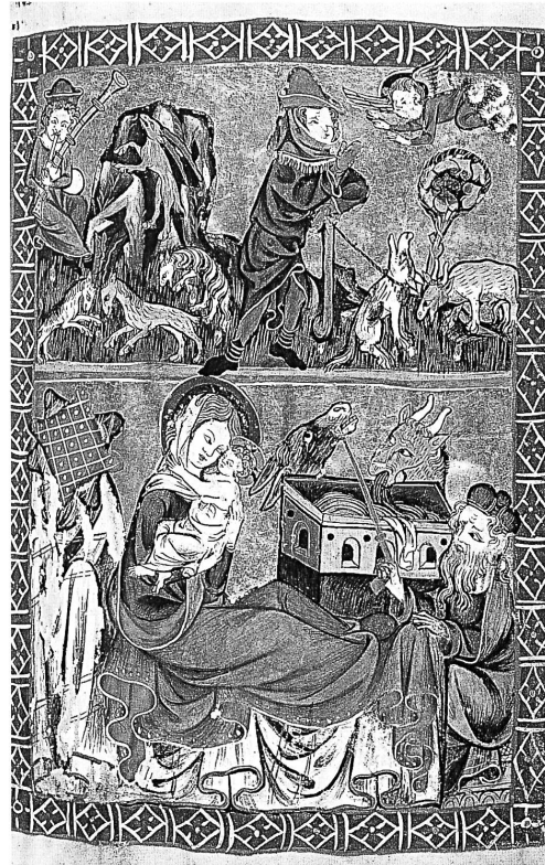
Abb. 3: Psalter, fol. 5r: Verkündigung an die Hirten, Geburt Christi, Blattgröße 273 x 192 mm, 2. Viertel 14. Jh., Manchester, John Rylands University Library, Ms. lat. 95.

Szene: Die Hebamme, die in Hockstellung zu Füßen Elisabeths kauert und den neugeborenen Knaben in den Armen hält, scheint ihrerseits schwanger zu sein. Sie trägt ein direkt unter der Brust gegürtetes, dunkelgrünes Kleid und hat einen auffallend runden Unterleib. Alle anderen Frauen im Miniaturenzyklus sind mit gürtellosen Gewändern bekleidet, die ohne Betonung der Taille von den Schultern herunterfallen. Ein hochsitzender Gürtel und ein gewölbter Bauch hingegen sind bekannte Bildformeln für die schwangere Gottesmutter. Diese nimbierte Hebamme 6 ist deshalb als Maria zu identifizieren. In der »Legenda aurea« wird berichtet, dass Maria nach ihrem Besuch bei Elisabeth drei Monate bei ihrer Freundin geblieben sei »und ihr diene, und als das Kind geboren war, hob sie es von der Erde auf mit ihren heiligen Händen, und tat also mit Fleiss einer Kindsmagd Dienst.« 7