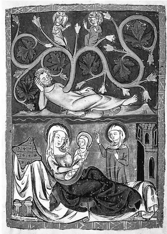
Abb. 1: Psalter, fol. 4r: Wurzel Jesse, Geburt der Maria, Blattgrösse 273 x 192 mm, 2. Viertel 14. Jh., Manchester, John Rylands University Library, Ms. lat. 95.