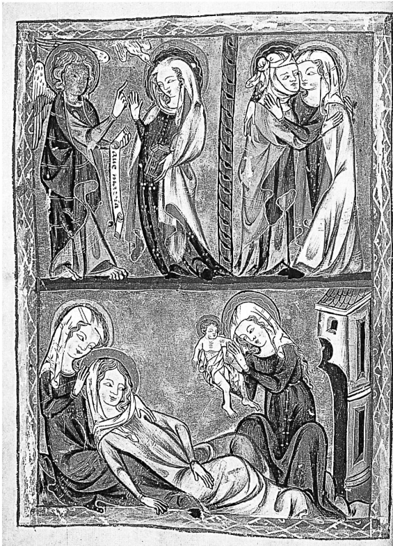
Abb. 2: Psalter, fol. 4v: Verkündigung an Maria, Visitation, Geburt von Johannes dem Täufer, Blattgröße 273 x 192 mm, 2. Viertel 14. Jh., Manchester, John Rylands University Library, Ms. lat. 95.