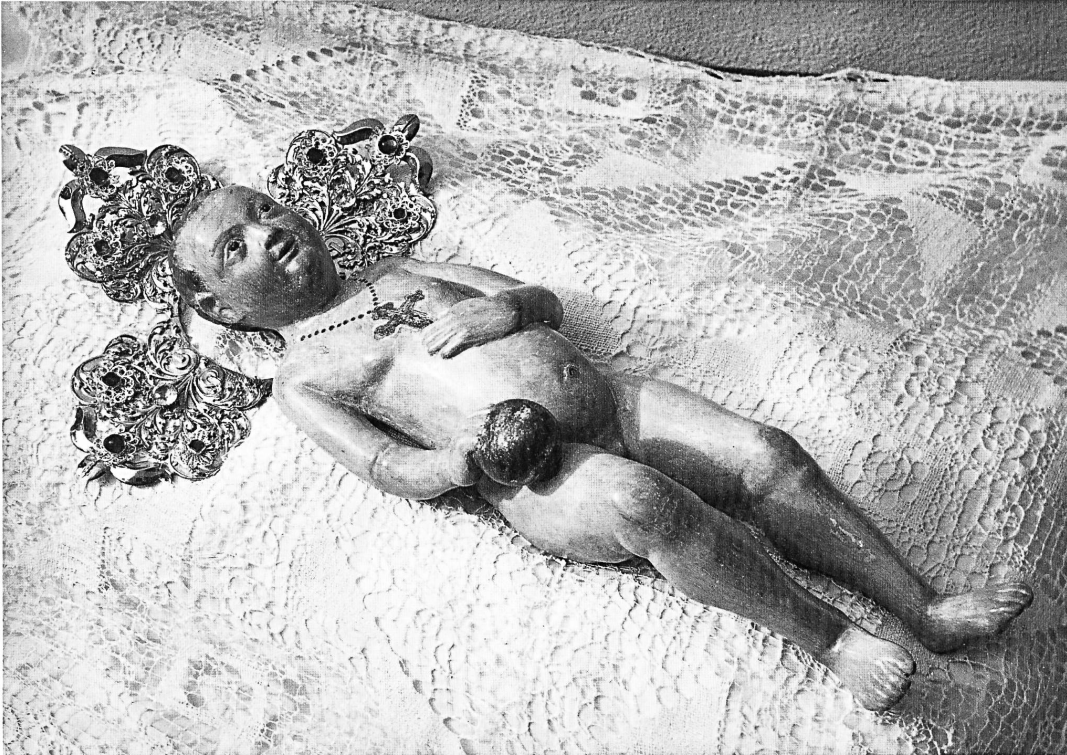
Abb. 7: »Sarner Kindli«, um 1400 (?), Holz, gefasst, Länge 50 cm, Benediktinerinnenkloster St. Andreas in Sarnen, Kanton Obwalden.