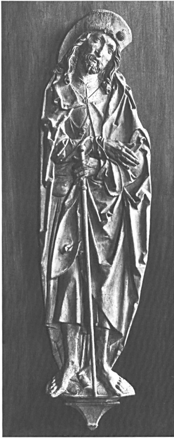
Abb. 3: Tilman Riemenschneider, »Der hl. Jakobus d. Ä.«, um 1510, Lindenholz-Relief, Höhe 126 cm, Öffentliche Kunstsammlung Basel, Kunstmuseum, Inv. P 95.