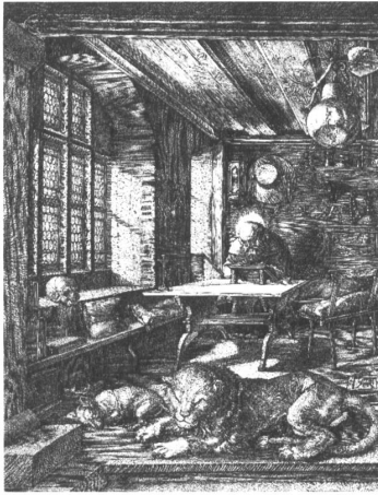
Abb. 2: Albrecht Dürer, »Der hl. Hieronymus in der Studierstube«, 1514, Kupferstich, 24,4 x 18,5 cm, Öffentliche Kunstsammlung Basel, Kupferstichkabinett.

Ideen- und Bildungsgeschichte, die bei Heinrich Wölfflin zu lesen erstaunlich sind; es sind Versatzstücke moralisierender Kritik. Freilich: einzigartig sind sie eben gerade nicht. Denn Wölfflins Polarität im persönlichen Erleben von nördlicher und südlicher Kunst entsprach einer Wertepolarität, wie sie die deutsche Geistesgeschichte im 19. und in der ersten Hälfte des 20. Jahrhunderts beherrschte.