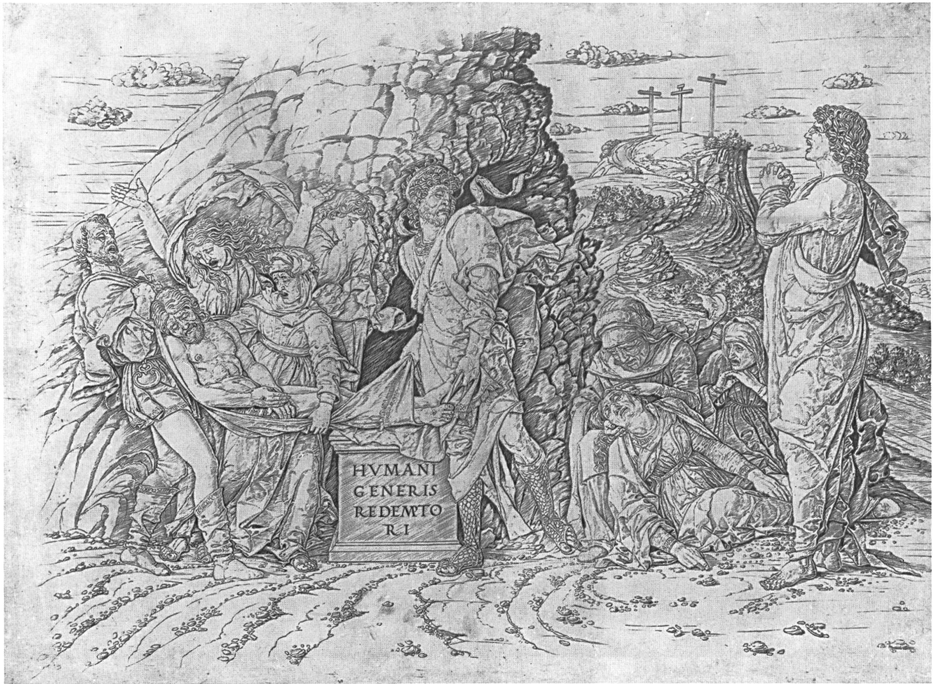
Abb. 1: Andrea Mantegna, Grablegung Christi, ca. 1470–1480 oder 1488–1490?, Kupferstich, 33,9 x 48 cm, London, British Museum.