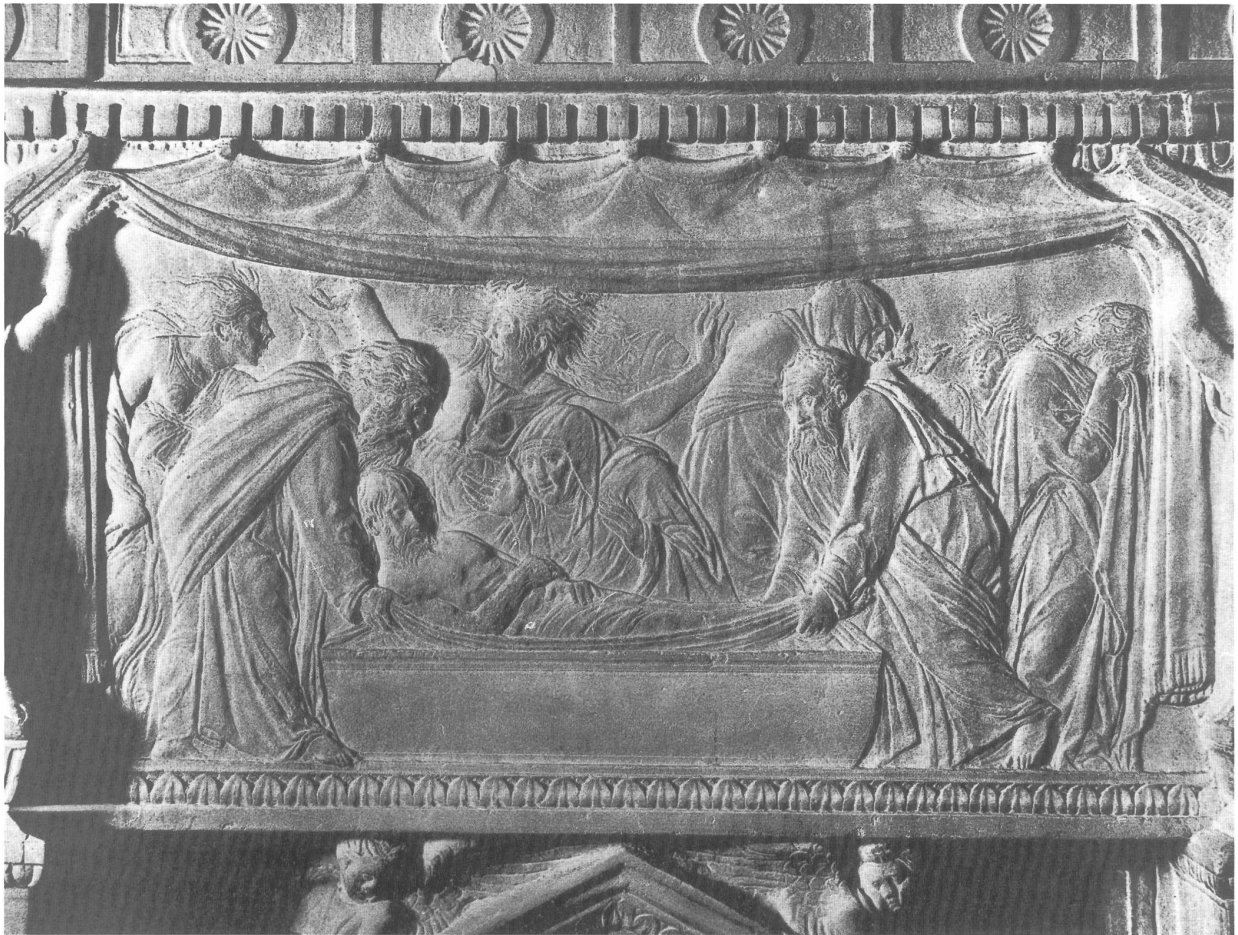
Abb. 2: Donatello, Grablegung Christi, ca. 1432–1433, Marmorrelief, 225 x 120 cm, Rom, Sankt Peter.