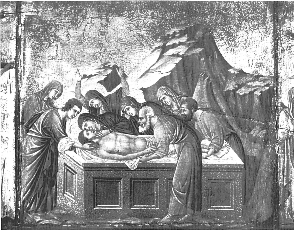
Abb. 3: Duccio, Beweinung Christi, Rückseite der »Maestà«, 1308–1311, 101 x 53,5 cm, Siena, Dommuseum.