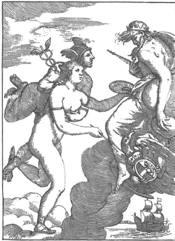
Abb. 9: Marco Boschini, »Merkur, Jupiter die Pittura darreichend«, Frontispiz in: Carta I666.