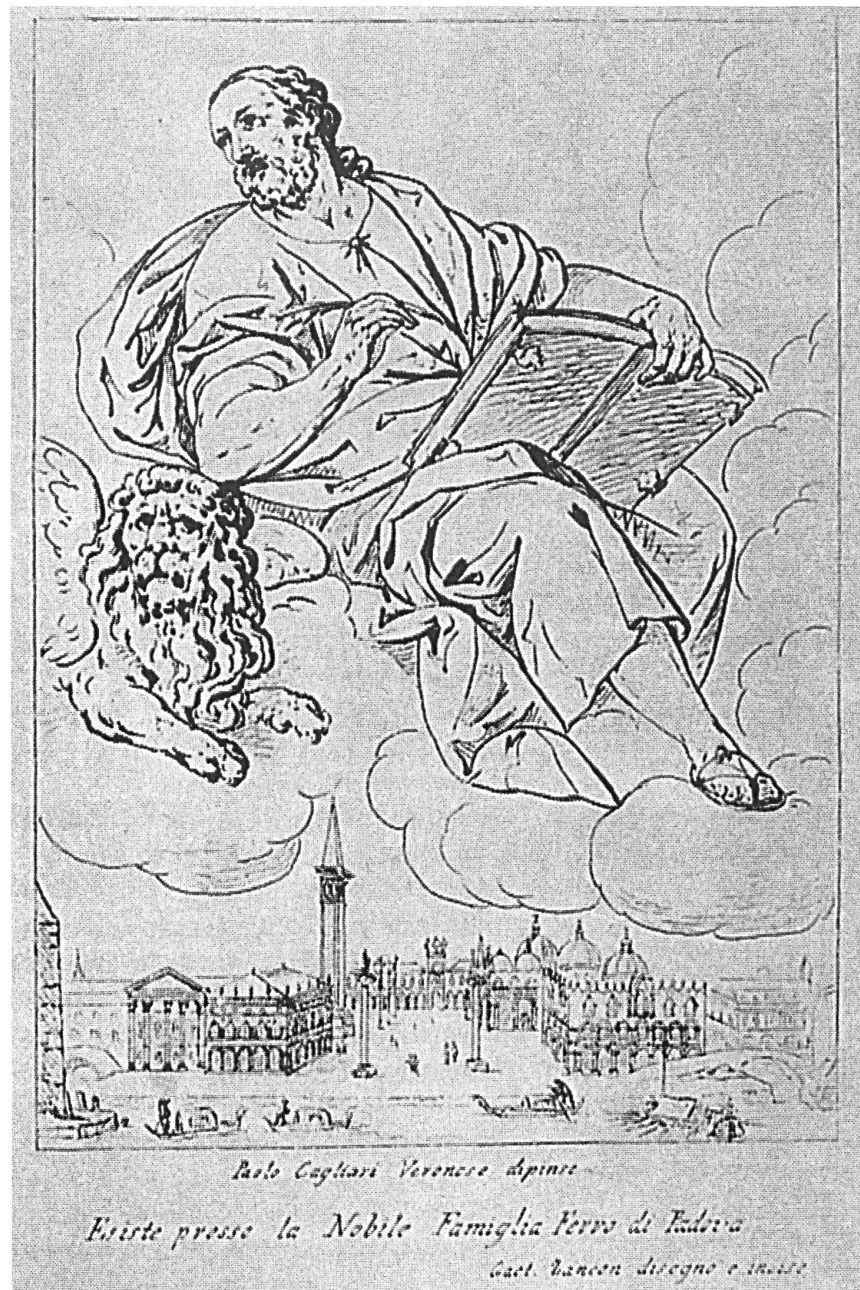
Abb. II: Gaetano Zancon, »San Marco«, 1802, Radierung nach einem früher Paolo Veronese zugeschriebenen Gemälde.