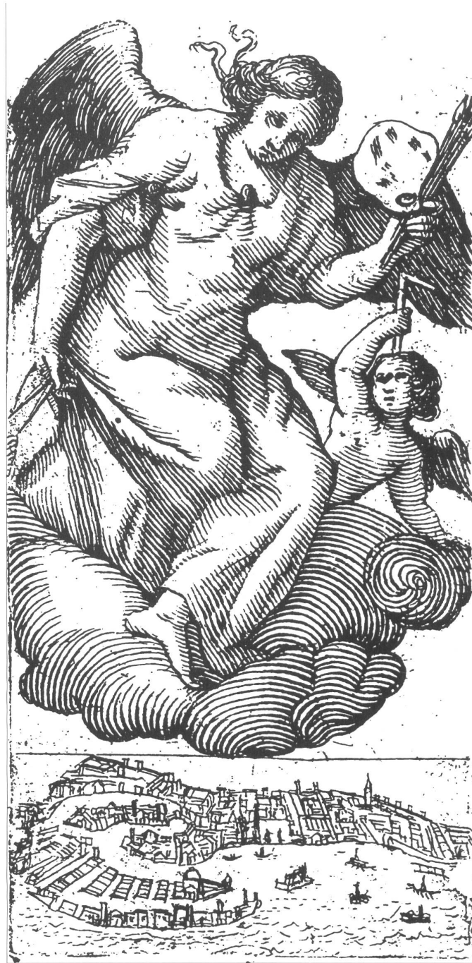
Abb. 10: Marco Boschini, »Pittura mit Cupido über Venedig«, Frontispiz in: Minere I664.