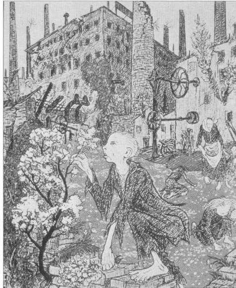
Abb. 4: Thomas Theodor Heine, Frühling (aus: Glaser, Hermann, Die Kultur der Wilhelminischen Zeit. Topographie einer Epoche, Frankfurt a. M. 1984, S. 108).