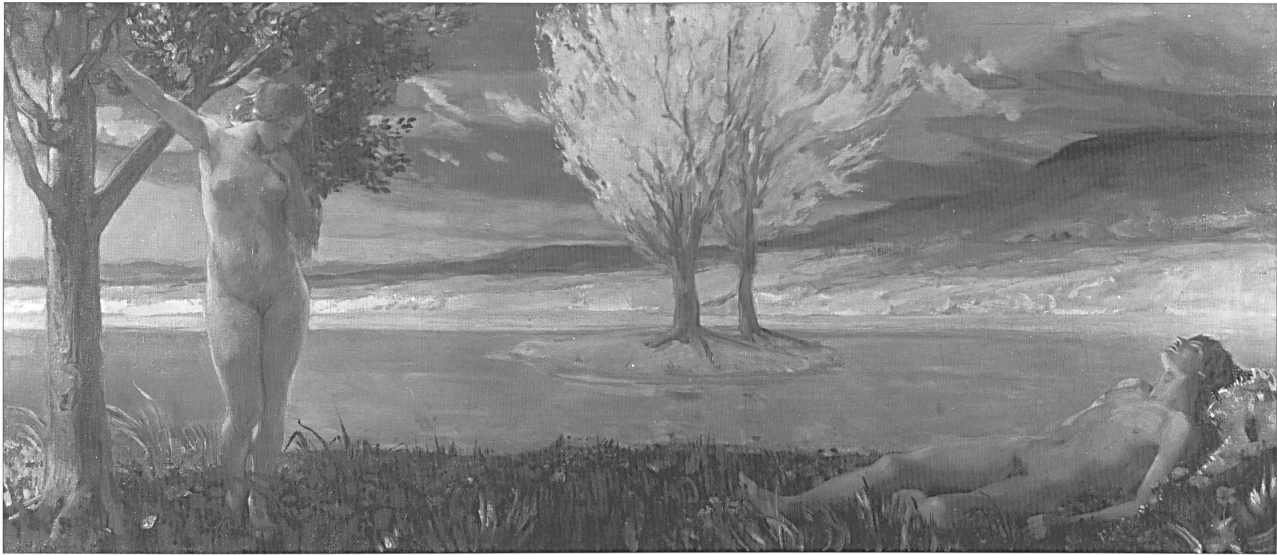
Abb. 2: Ludwig von Hofmann, Adam und Eva (in paradiesischer Landschaft), 1897, Öl auf Leinwand, 91,5 x 209,5 cm, Leipzig, Museum der bildenden Künste.