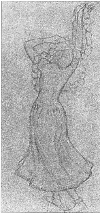
Abb. 11, 12: Ludwig von Hofmann, Ruth St. Denis, 1906 (aus: Kunst und Künstler 5, Januar 1907, H. 5, S. 157 u. 158).