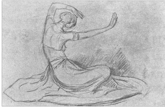
Abb. 14: Ludwig von Hofmann, Ruth St. Denis, 1906 (aus: Kunst und Künstler 5, Januar 1907, H. 5, S. 159).