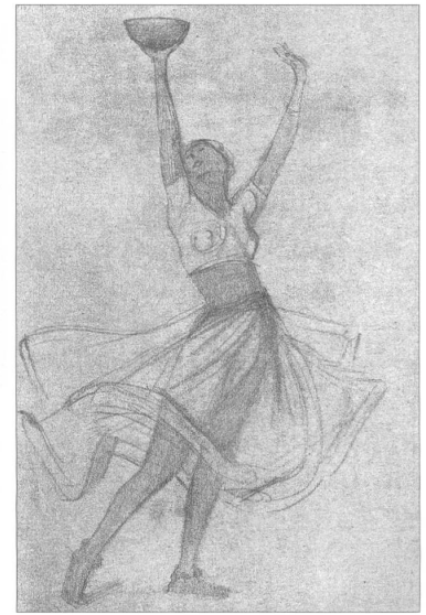
Abb. 8, 9, 10: Ludwig von Hofmann, Ruth St. Denis, 1906 (aus: Kunst und Künstler 5, Januar 1907, H. 5, S. 132, 155 u. 156).