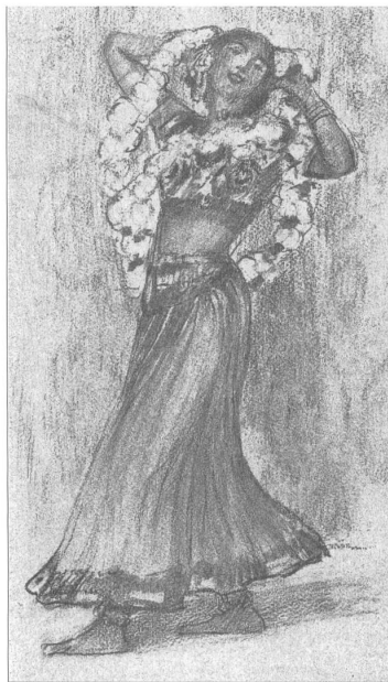
Abb. 17: Ludwig von Hofmann, Ruth St. Denis, 1906 (aus: Kunst und Künstler 5, Januar 1907, H. 5, S. 162).