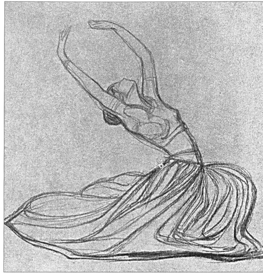
Abb. 16: Ludwig von Hofmann, Ruth St. Denis, 1906 (aus: Kunst und Künstler 5, Januar 1907, H. 5, S. 161).