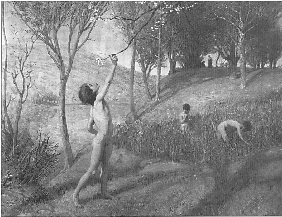
Abb. 1: Ludwig von Hofmann, Frühling, 1895, Öl auf Leinwand, 92 x 118 cm, Dresden, Gemäldegalerie Neue Meister, Staatliche Kunstsammlungen Dresden (Inv. Nr. 2509 B).