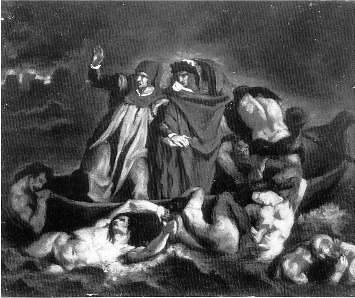
Edouard Manet, «La Barque de Dante», d'après Delacroix, vers 1855, Huile sur toile, 38 x 46 cm, Lyon, Musée des Beaux-Arts.