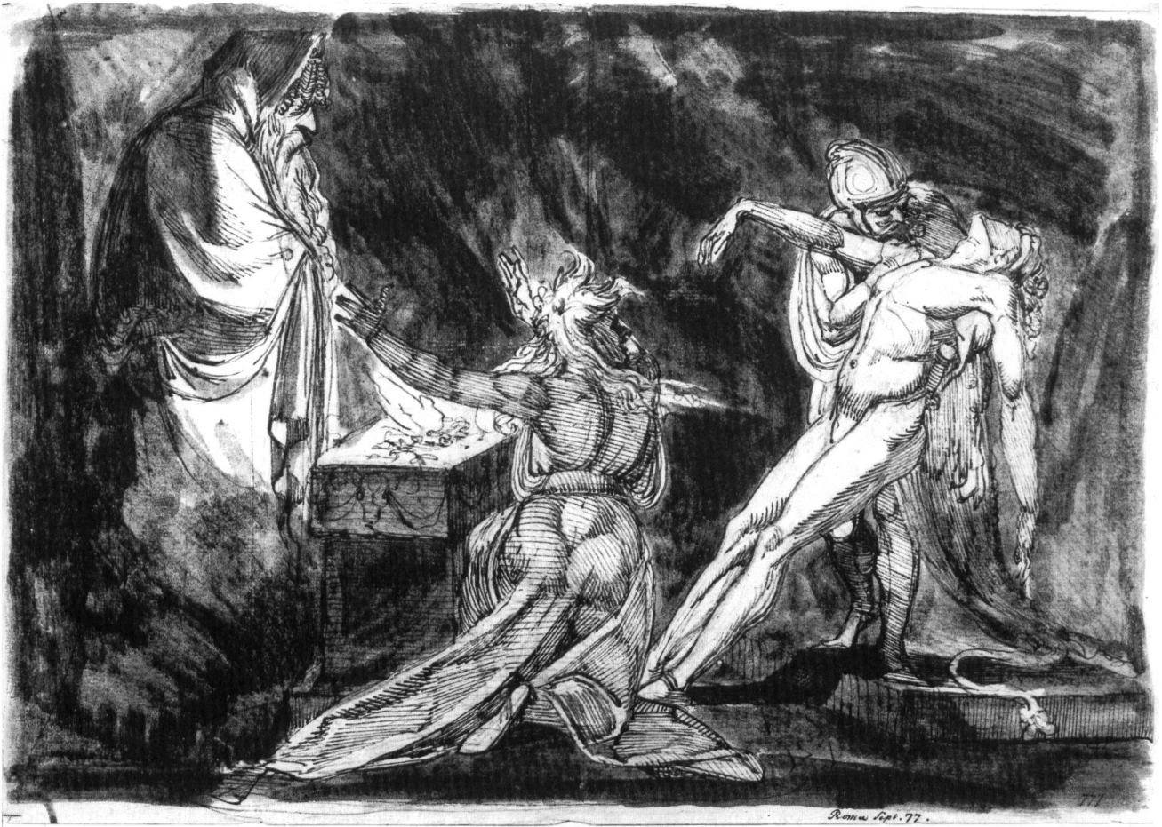
Abb. 1: Johann Heinrich Füssli, »Samuel erscheint Saul bei der Hexe von Endor«, 1777, Feder, laviert, 25,8 x 37,2 cm, London, Victoria-und-Albert-Museum.

wachsenden Geniekults war sentimentale Anwandlung in Künstlerkreisen nicht angebracht. Besass ein Künstler schwache Nerven oder ein unterentwickeltes Selbstbewusstsein, konnte ihn der Stress des Konkurrenzkampfes leicht – wie der Fall George Romneys zeigt – in Depression und Wahnsinn treiben. Es gab einen Trost: Wahnsinn wurde als Zeichen des Genies verbrämt. James Barry war eines der bekanntesten Opfer der harten Marktpraktiken. Sein unfreiwilliges Ausscheiden als Professor der Kunstakademie im Jahre 1799 bedeutete für ihn eine persönliche Katastrophe, für Füssli jedoch den Aufstieg zu einer gesicherten Position innerhalb der Kunstschule.