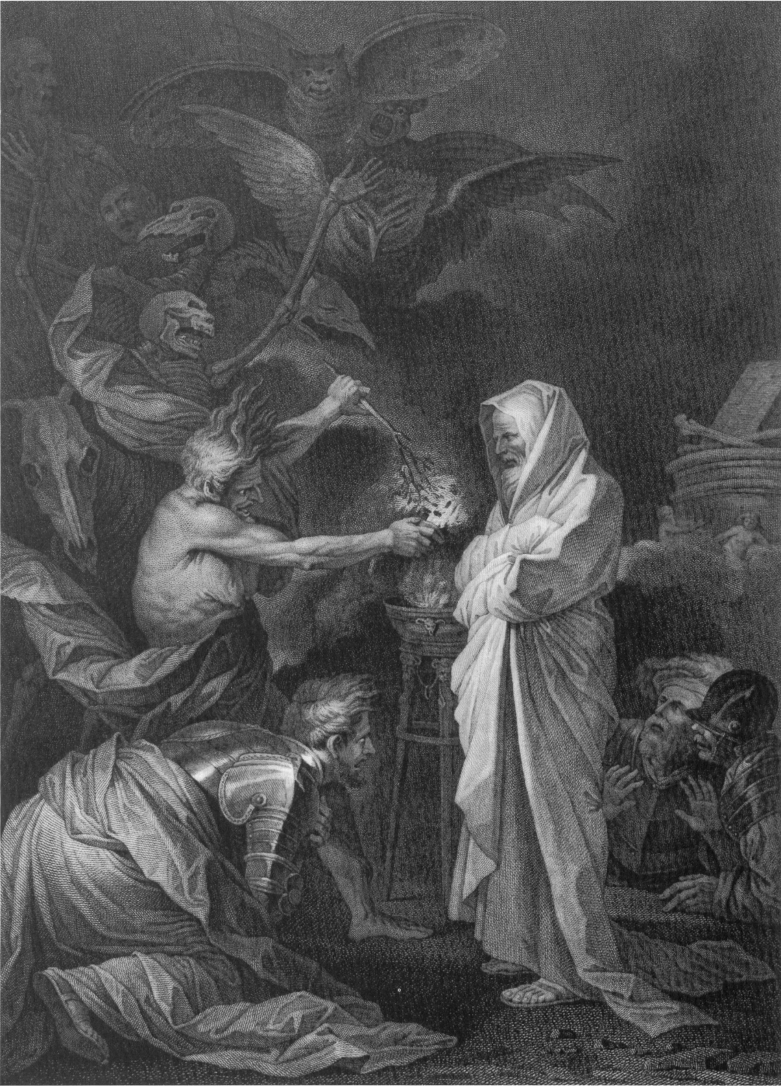
Abb. 3: Salvator Rosa, «Samuel erscheint Saul bei der Hexe von Endor», Kupferstich von Heinrich Guttemberg, 48,2 x 34,2 cm, Zürich, Graphische Sammlung der ETH.