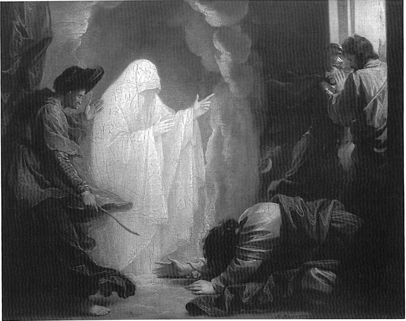
Abb. 4: Benjamin West, »Saul and the Witch of Endor«, 1777, Öl auf Leinwand, 52,0 x 68,5 cm, Hartford, Wadsworth Atheneum, Bequest of Mrs. Clara Hinton Gould.