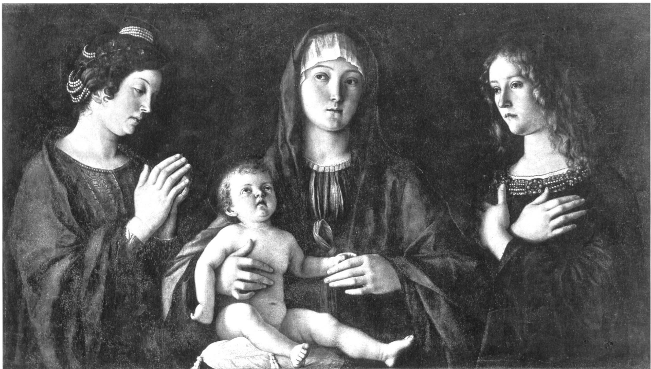
Abb. 4: Giovanni Bellini, „Madonna mit Kind zwischen zwei weiblichen Heiligen“, 1490–95, Öl auf Holz, 58 x 107 cm, Venedig, Galleria dell'Accademia.