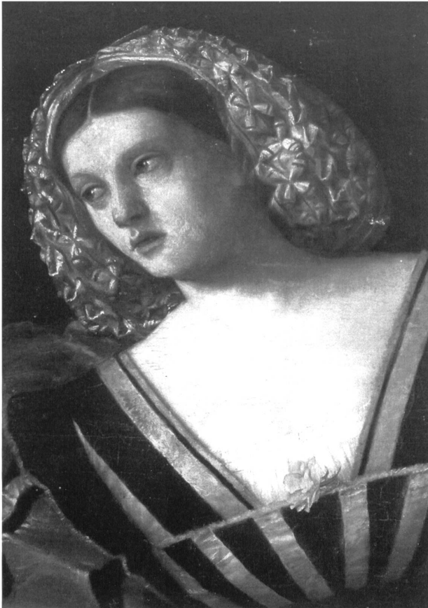
Abb. 8: Unbekannter Künstler, Mythisches Hochzeitsbild, Unglückliche Braut (Ausschnitt).

Statius und Claudianus. 39 Statius beispielsweise schildert detailliert das hochzeitliche Geschehen in Verbindung mit mythologischen Hochzeiten. In mythischen Bildern des frühen 16. Jahrhunderts mit Darstellungen von Braut und Venus ist ein Bezug zum römischen Hochzeitsgedicht nahe liegend. 40