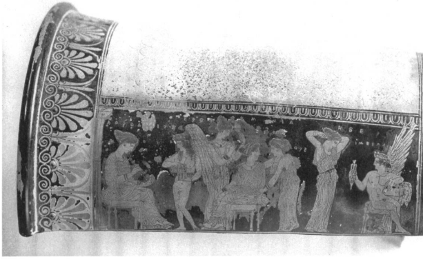
Abb. 10: Eretria-Maler, »Epinetron«, um 425–420 v. Chr., Tongefäß, Länge: 29 cm, Athen, Nationalmuseum.