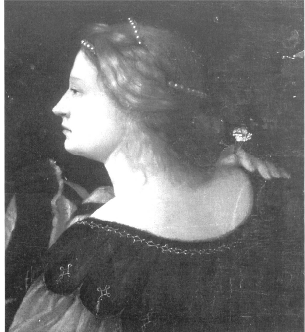
Abb. 3: Unbekannter Künstler, Mythisches Hochzeitsbild, Venus (Ausschnitt).