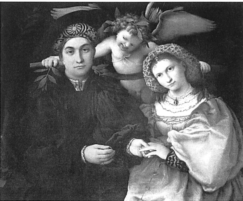
Abb. 7: Lorenzo Lotto, „Hochzeitsbild des Messer Marsilio und seiner Frau“, 1523, Öl auf Leinwand, 71 x 84 cm, Madrid, Prado.