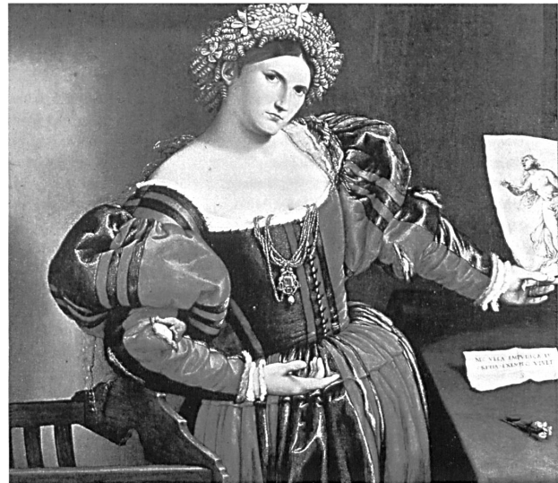
Abb. 15: Lorenzo Lotto, »Lucretia«, Öl auf Leinwand, um 1533, 95,9 x 110,5 cm, London, National Gallery.

Nach der aristotelischen Unterscheidung von den vier menschlichen Temperamenten zählen zu den Merkmalen des Melancholikers Kontemplation und Reflexion. 92 Das Reflektieren der Braut steht hier in Zusammenhang mit ihrem Zögern. Der Blick der Venus drückt hingegen Strenge aus: Vielleicht will sie der Braut die Tugenden einer guten Ehefrau nahe bringen. Keuschheit (Mauerblümchen), Treue (»dextrarum iunctio«) und Untergebenheit (Perlen)