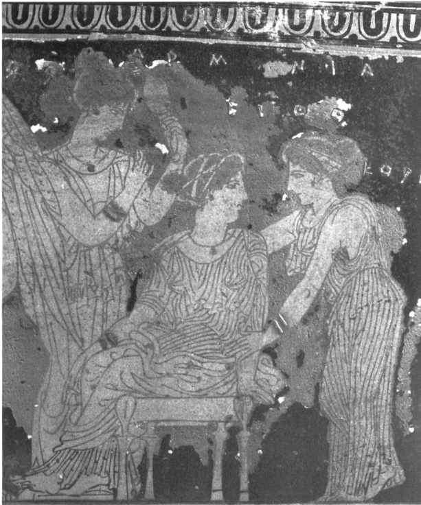
Abb. 11: Eretria-Maler, »Epinetron«, Peitho, Harmonia und Kore (Ausschnitt).

Unterschied: Im Gemälde legt nicht Venus ihre Hand auf die Schulter der Braut, sondern die Braut sucht hier die Hilfe der Liebesgöttin. Auch die Ursache für den melancholischen Ausdruck der Braut im »mythischen Hochzeitsbild« – sie zögert, zu heiraten – legt einen Zusammenhang mit dem »Epithalamium« des Claudianus nahe. Die zögernde Braut gehörte möglicherweise in der Antike einem festen Kanon der Hochzeitstopik an. Bereits in der römischen Wandmalerei zu Beginn unserer Zeitrechnung wird das Zögern der Braut thematisiert. In der so genannten »Aldobrandinischen Hochzeit« ist nach Curtius die Vorbereitung einer Hochzeit verbildlicht. 45 Dort legt Aphrodite tröstend ihren Arm um die Schulter der in sich versunkenen Braut. 46 Im »mythischen Hochzeitsbild« wird dieses Motiv vom unbekanntem Künstler innovativ verwendet, indem die Braut die Hilfe der Venus sucht.