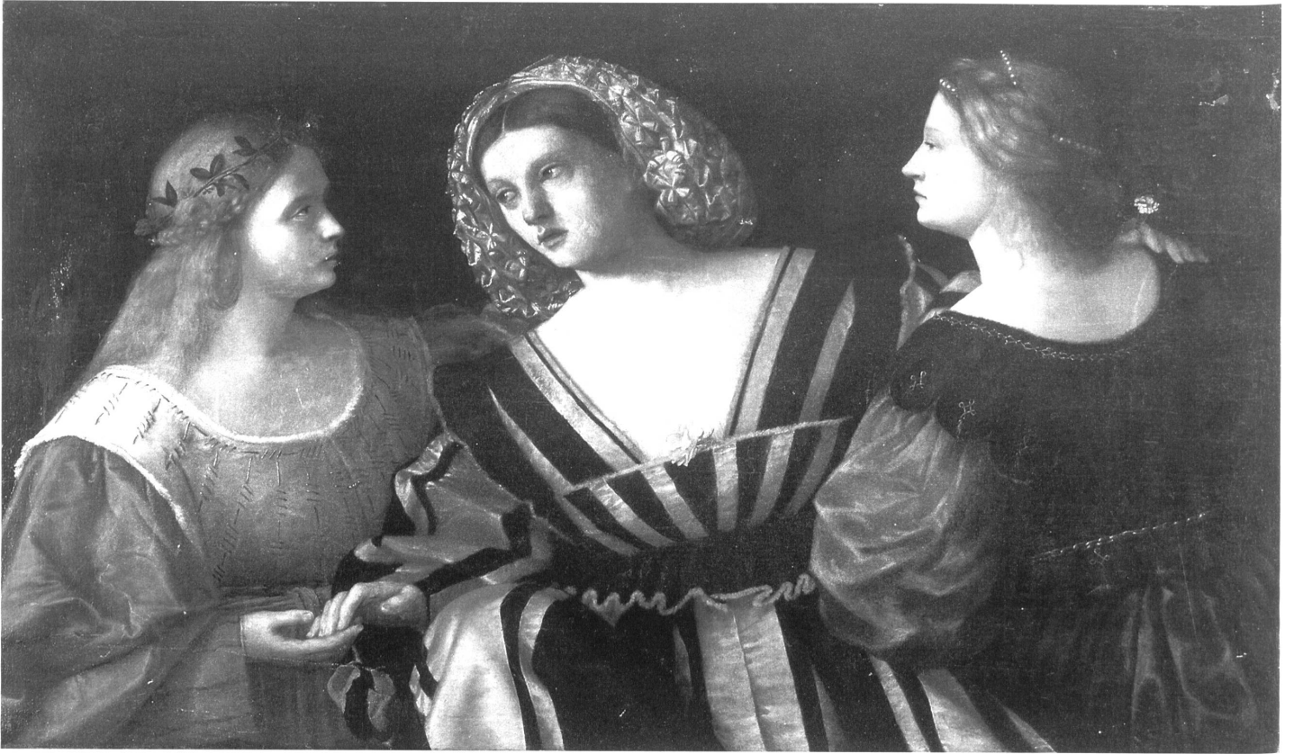
Abb. 1: Unbekannter Künstler, Mythisches Hochzeitsbild, zwischen 1520 und 1530, Öl auf Leinwand, 75 x 125,5 cm, Privatbesitz.