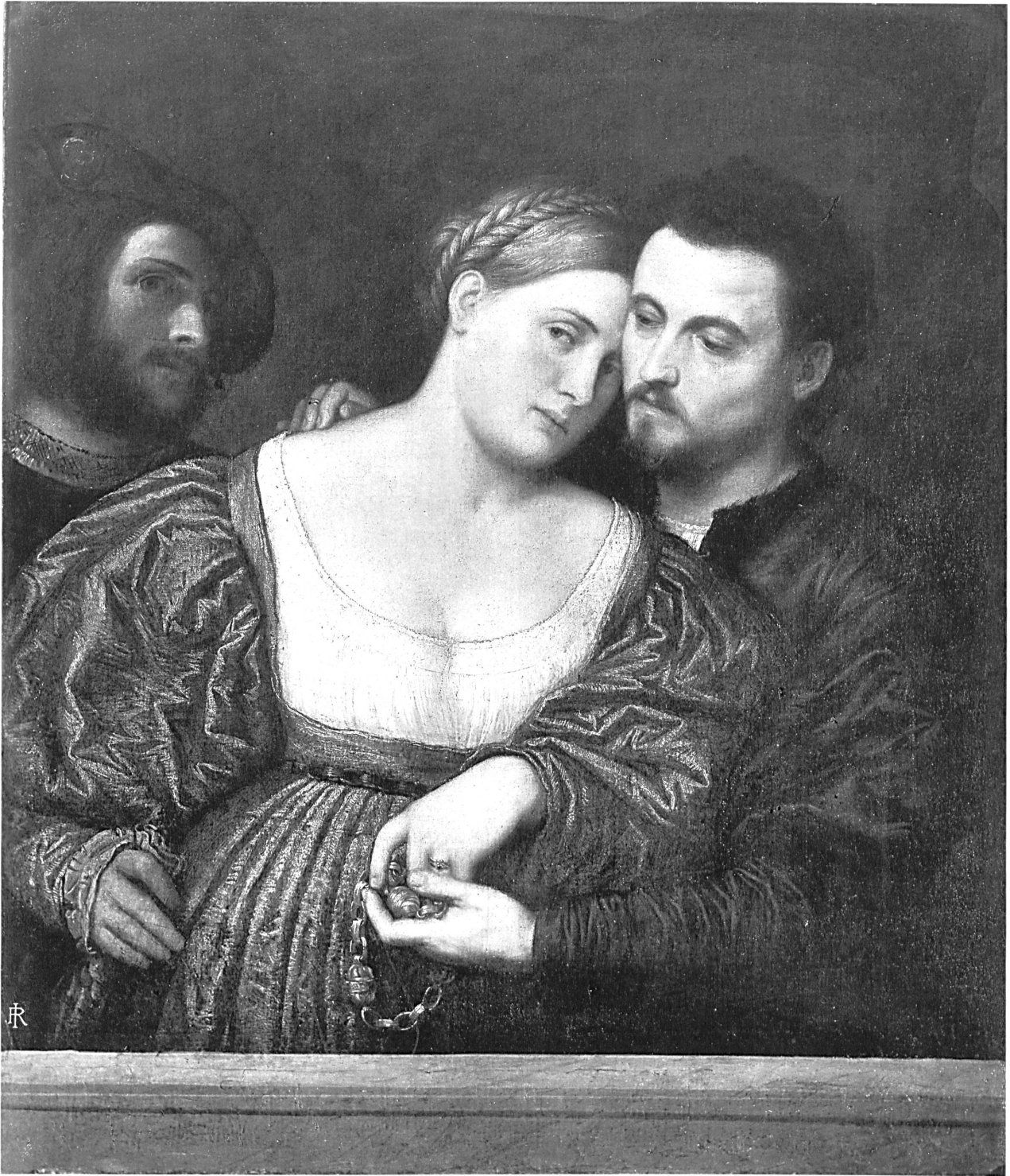
Abb. 9: Paris Bordone, »Venezianisches Paar«, um 1530, Öl auf Leinwand, 95 x 80 cm, Mailand, Pinacoteca di Brera.