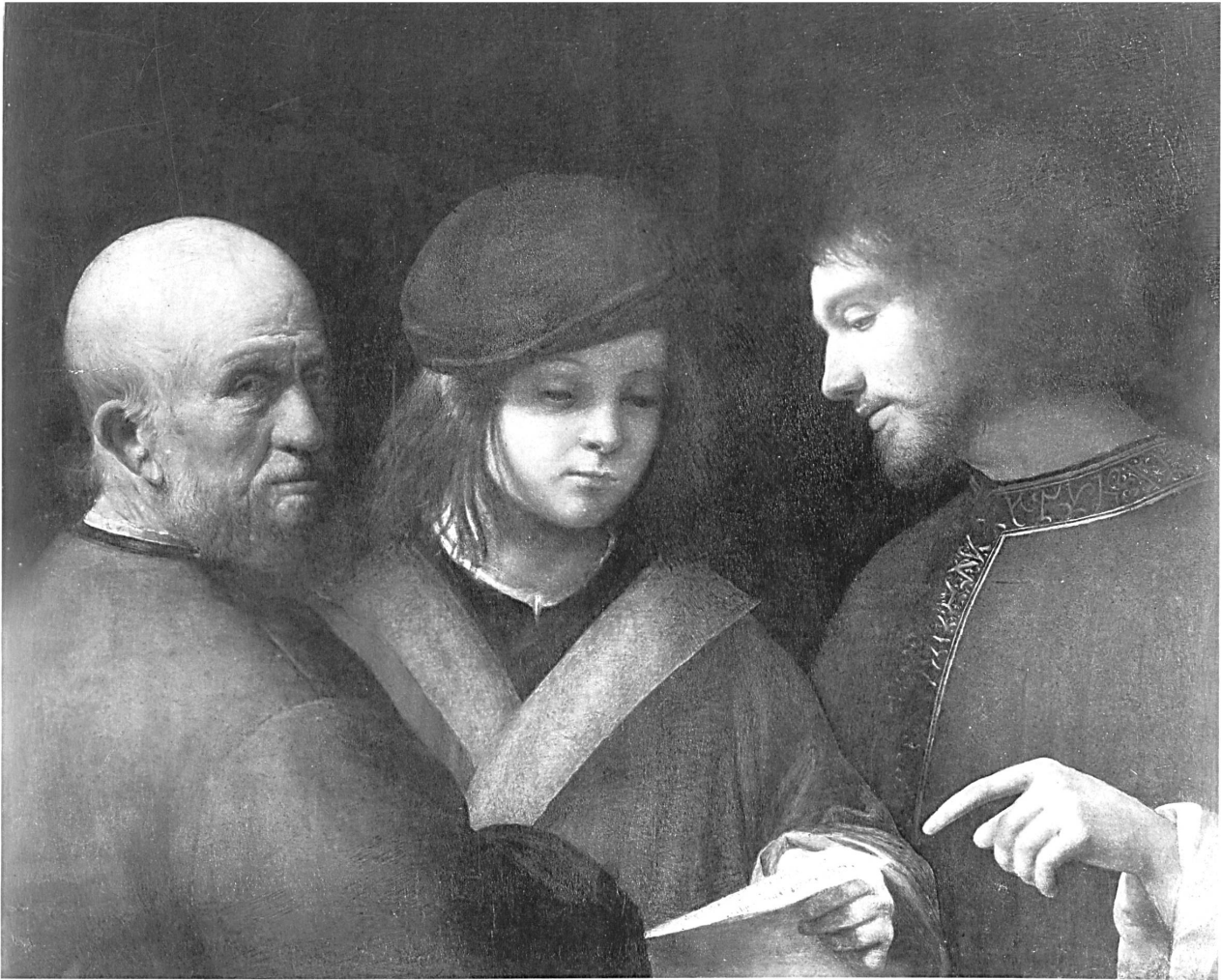
Abb. 5: Giorgione, »Die drei Lebensalter«, um 1510, Öl auf Holz, 62 x 77 cm, Florenz, Palazzo Pitti.

wird im »mythischen Hochzeitsbild« die auf Synkrisis beruhende Porträtauffassung des 16. Jahrhunderts umgesetzt, bei welcher das Nebeneinander, d. h. die sukzessive Wahrnehmung von Frontalansicht zu Profilansicht, und der damit einsetzende Vergleich eine Voraussetzung bilden. 10