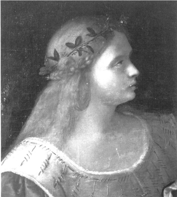
Abb. 2: Unbekannter Künstler, Mythisches Hochzeitsbild, Brautbegleiterin (Ausschnitt).