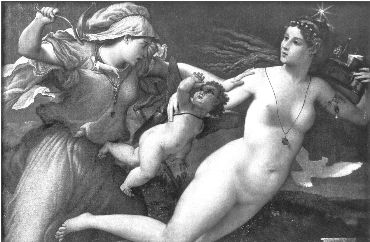
Abb. 14: Lorenzo Lotto, »Triumph der Keuschheit«, Öl auf Leinwand, um 1526, 73 x 114 cm, Rom, Palazzo Rospiglioso Pallavicini.

schlussreich ist allerdings, dass der heute kaum mehr geläufige Topos der »unglücklichen Braut« demnach im 16. Jahrhundert verbreitet war. 71