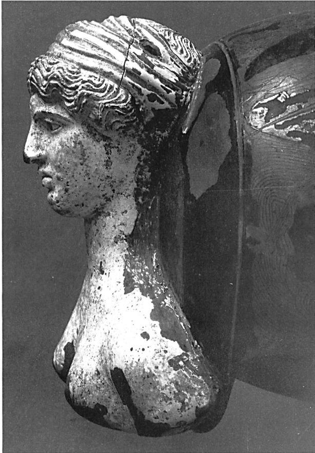
Abb. 13: Eretria-Maler, »Epinetron«, Gefäßkopf mit Aphrodite.

Reinheit, symbolisiert durch den Hermelin, ein Tiersymbol, das aus Leonardos berühmtem »Bildnis einer Dame mit Hermelin« in Krakau bekannt ist. 58 Bereits Pisanello benutzte auf der Rückseite einer Medaille von 1447 einen Hermelin auf vegetativem Untergrund als Symbol für die Tugendhaftigkeit. 59 Im Zentrum einer Intarsie nach dem Entwurf Lottos für das Chorgestühl in Santa Maria Maggiore in Bergamo steht ebenfalls ein Hermelin. Lotto formte dabei aus dem geläufigen Tiersymbol eine Imprese mit verborgener Moral. 60 Der komplexe moralische Gehalt wird dort durch folgendes Motto erläutert: Poc(τ)IUS MORI (lieber Sterben). 61