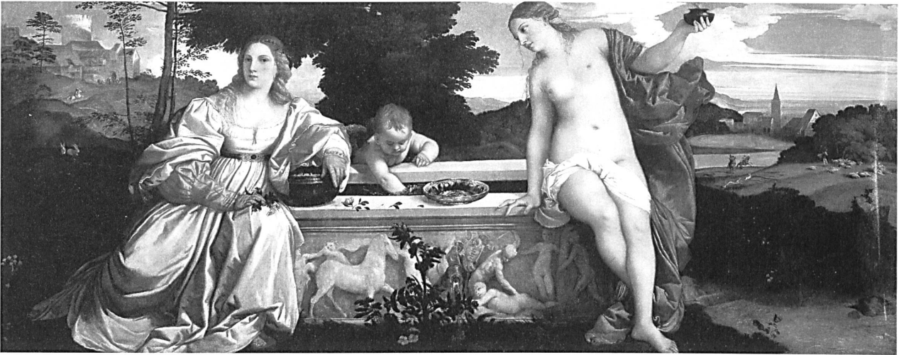
Abb. 6: Tizian, sog. „Amor Sacro e Profano“, um 1516, Öl auf Leinwand, 118 x 279 cm, Rom, Galleria Borghese.