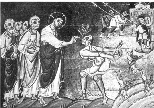
Abb. 3: »Heilung des Besessenen von Gerasa«, Miniatur aus dem Evangeliar Ottos III., um 1000, München, Bayerische Staatsbibliothek Clm. 4453, fol. 103v.

Die Beschäftigung mit mittelalterlicher Kunst war auch ein wichtiger Bestandteil des Unterrichts von Johannes Itten, der im Vorkurs den Studierenden Diapositive von Werken Cranachs, Grünewalds, aber auch von der ottonischen Buchmalerei zur Analyse vorführte (Abb. 3, 4 und 5). 13 Oskar Schlemmer beschreibt eine Unterrichtsstunde folgendermassen: »Itten gibt in Weimar »Analyse«. Zeigt Lichtbilder, wonach die Schüler dieses oder jenes Wesentliche zeichnen sollen; meist die Bewegung, die Hauptlinie, Kurve.