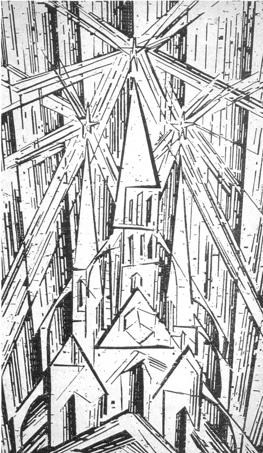
Abb. 1: Lyonel Feininger, „Kathedrale“, 1919, Holzschnitt, Titelblatt für das „Manifest und Programm des Staatlichen Bauhauses“.