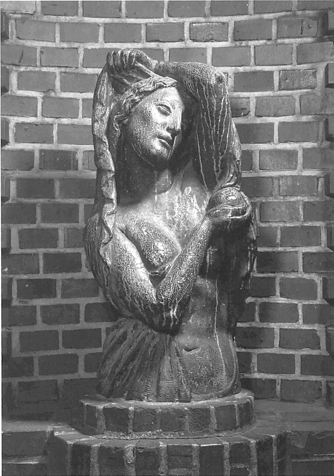
Abb. 2: Bernhard Hoetger, »Dämmerung«, auch: »Abend«, »Abenddämmerung«, 1912, Bronze, 0,54 m x 0,36 m x 0,30 m, Bremen, Kunstsammlungen Böttcherstrasse.