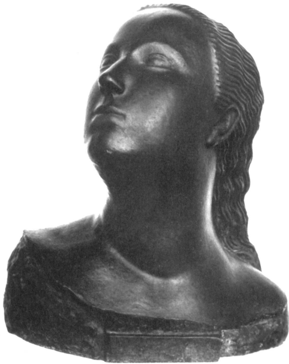
Abb. 1: Bernhard Hoetger, »Gedankenflug«, 1906/07, Bronze, Höhe: 0,47 m, Standort unbekannt.