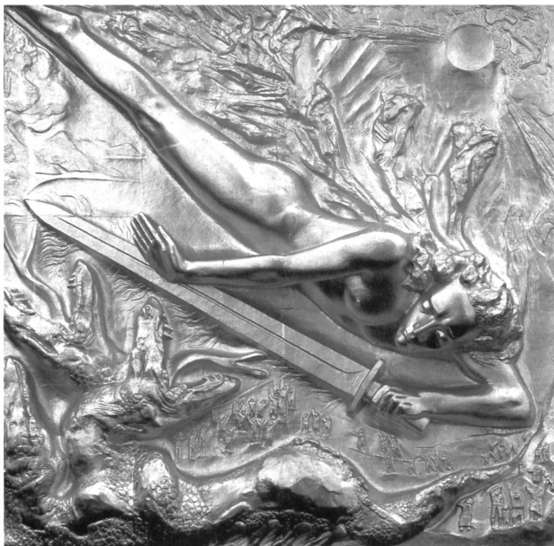
Abb. 6: Bernhard Hoetger, »Lichtbringer«, 1936/37, Relief, 3,84 m x 3,84 m, am Eingang der Böttcherstrasse, Bremen, zerstört.

So weit, so bekannt. Aber: »Die Darstellung verlangte die Flucht ins Geistige, die Abwendung von der Erde, die reine himmlische Liebe. [...] Was hier gerade zu einer starken und hingebenden Plastik führte, drängte die Menschen immer mehr zur Weltverneinung, womit schon der Keim der Abkehr von Welt und deren Schönheit gelegt und damit auch Darstellungs-Notwendigkeit verneint wurde. Die Verneinung der Welt wurde somit die Ursache zur Verneinung der Kunst – die Kirche wurde öde und leer. So verlor ihre Bewegung die Inbrunst des Lebens.« 32