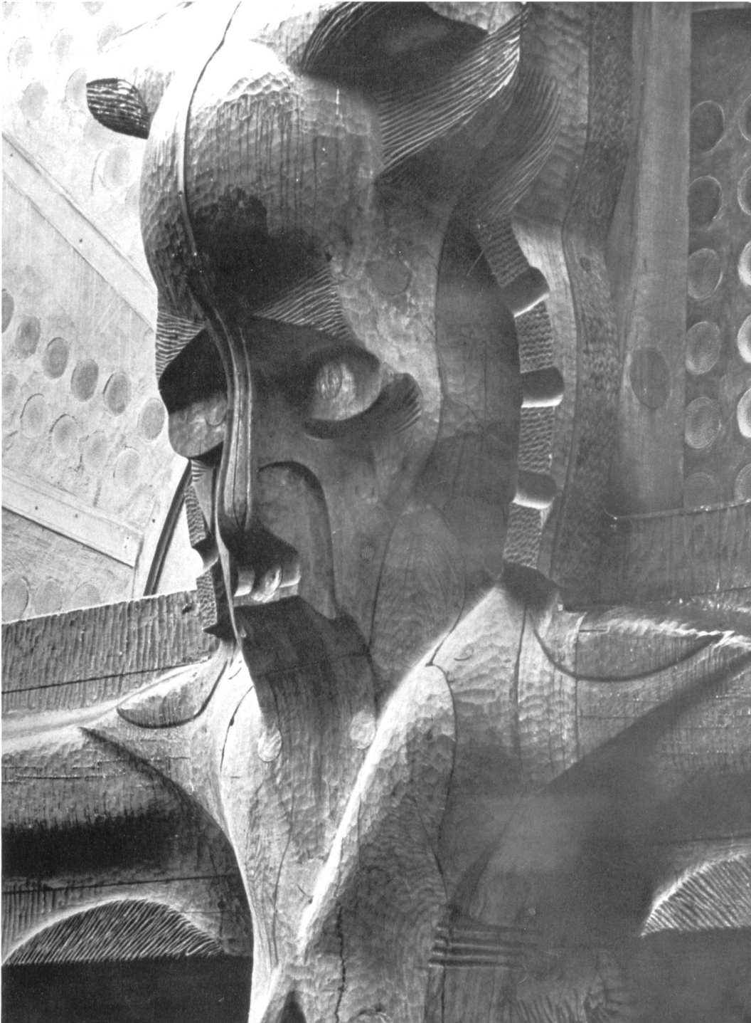
Abb. 5: Bernhard Hoetger, „Lebensbaum« oder -Odin-, Detail des Kopfes, Holzskulptur an der Eingangsfassade des Atlantishauses in Bremen, 1930/31, zerstört (Aufnahme vor 1944).