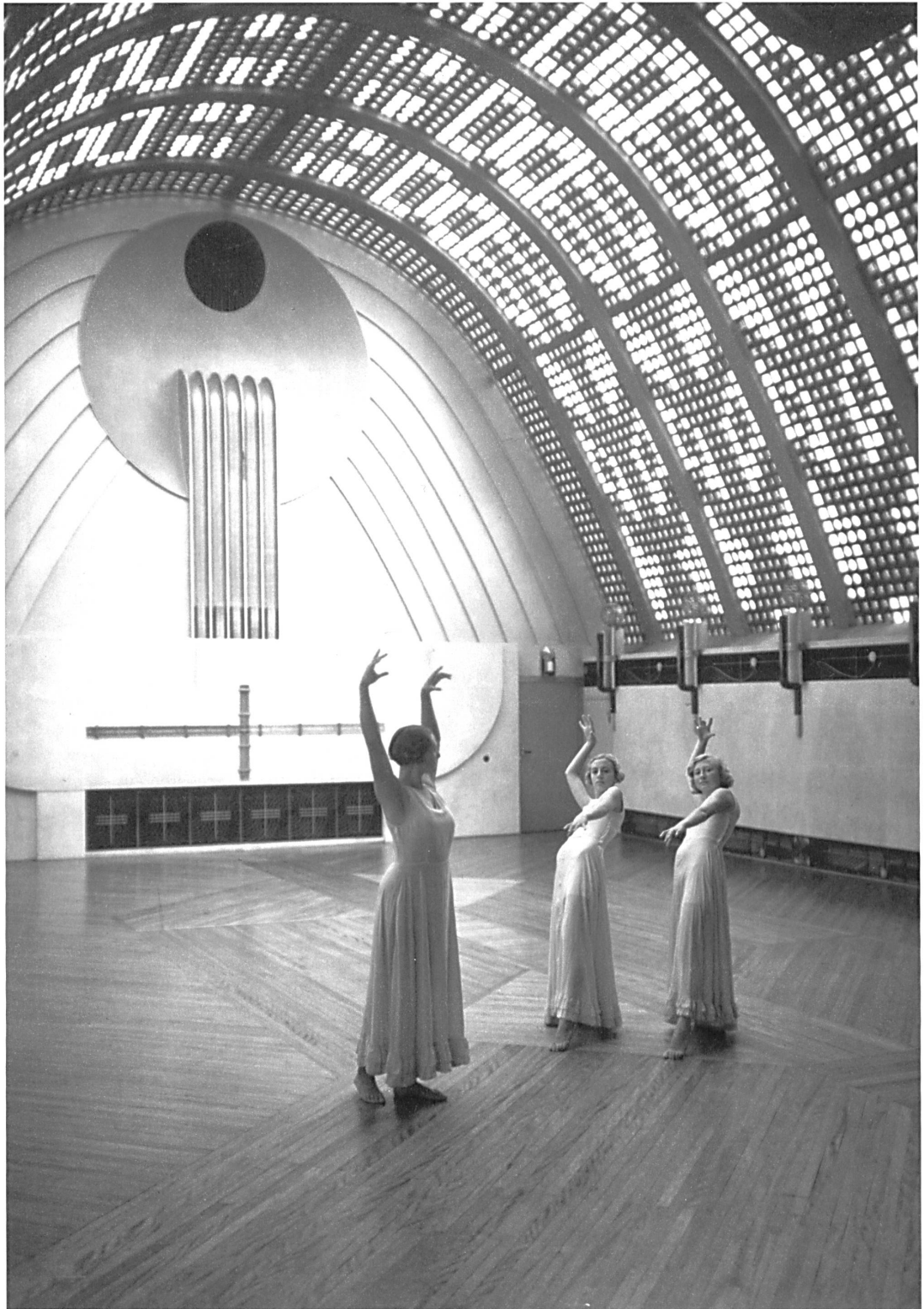
Abb. 4: Bernhard Hoetger, Himmelsaal des Atlantishauses in Bremen (mit Ausdruckstänzerinnen), um 1930.