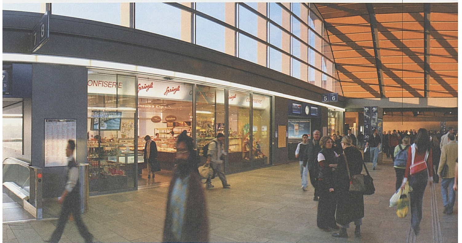
RailCity, Bahnhof Basel

Begegnungsort für Hunderttausende. Die sieben grössten Bahnhöfe der Schweiz, neu RailCity genannt,