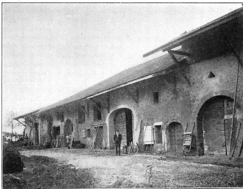
FIG. 30. — Maison rurale, Passeiry.