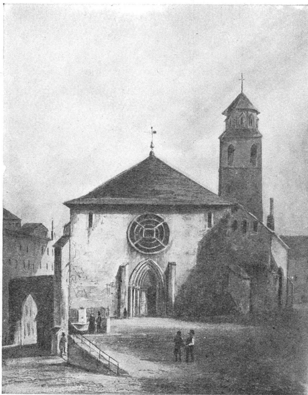
L'église La Madeleine, en 1837. (D'après une aquarelle d'Albert Hentsch.)