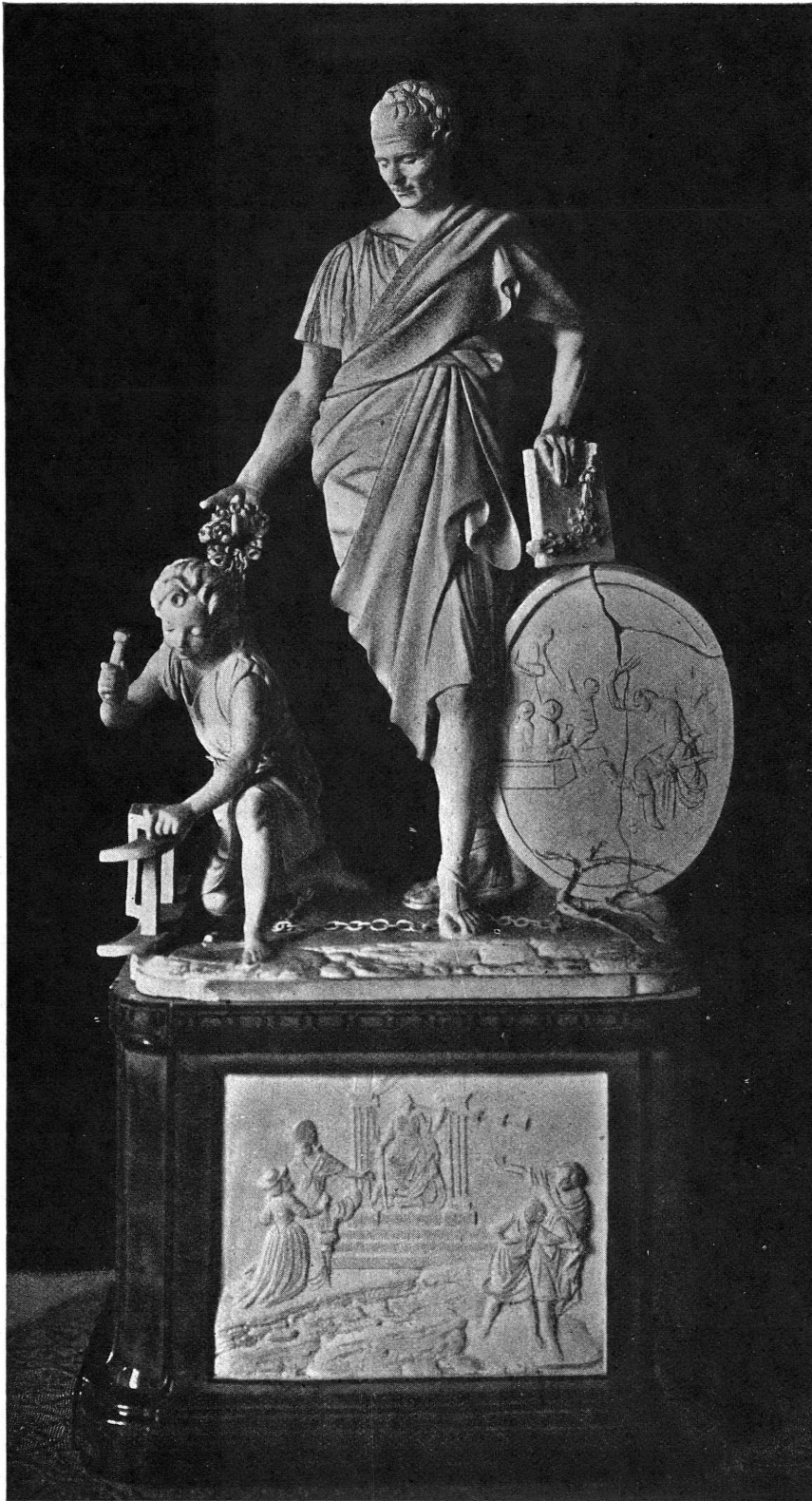
L'éducation d'Emile. Biscuit de Niederwiller. Musée de Genève.