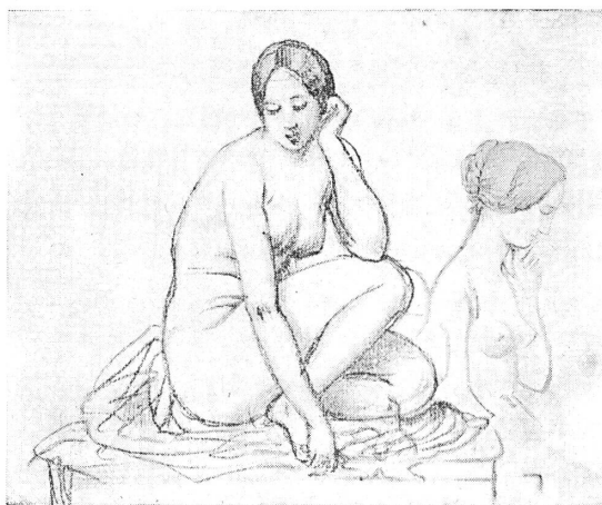
FIG. 1. — Femme accroupie.

1852-41. La ville de Nîmes; enfants pour le groupe du Dolce farniente; une victoire pour le tombeau de Napoléon . H. 0,20; L. 0,27. Croquis; mine de plomb sur papier blanc. Le groupe du Dolce farniente n'est pas cité par Lami; la notice de Lequesne ne dit pas s'il a été exécuté.