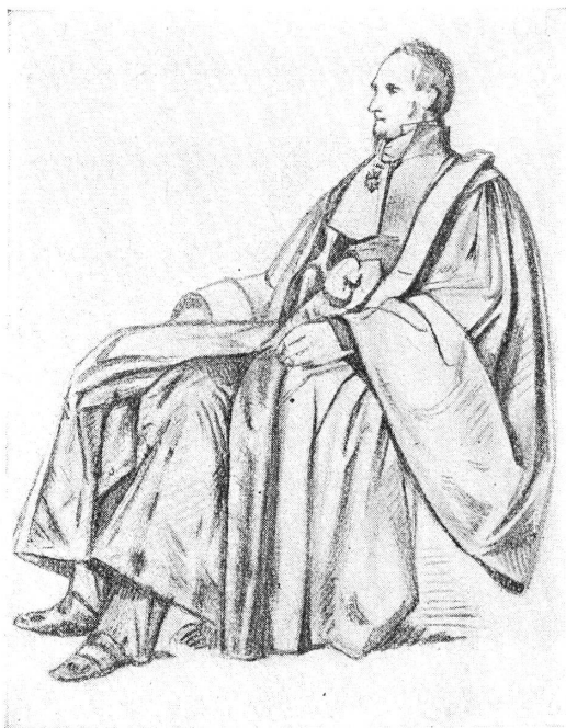
FIG. 2. — M. de Belleyme.

1852-48. Le général Damême . H. 0,23; L. 0,14. Deux croquis (figure en pied, tête nue; tête avec bicorne). Mine de plomb sur papier blanc. Notice de Lequesne: « Croquis de M. Pradier pour le concours de la statue du général Damême ». Cette statue n'est pas citée par Lami. Pas d'autre renseignement.