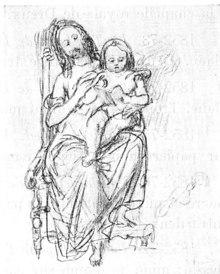
FIG. 3. — Le signe de croix.

1852-64. Puget . H. 0,17; L. 0,114. Croquis; mine de plomb sur papier blanc. Notice de Lequesne: « Première pensée de la statue de Puget commandée par la ville de Marseille et dont l'esquisse seule a été faite ». (Groupe; Puget est appuyé contre la statue colossale de Milon de Crotone.)