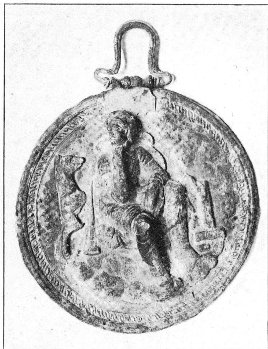
FIG. 1. — Miroir grec à relief.

Nous reproduisons encore des boucles d'oreille en or, qui ne sont pas des acquisitions récentes, mais qui méritent d'être signalées (fig. 2).