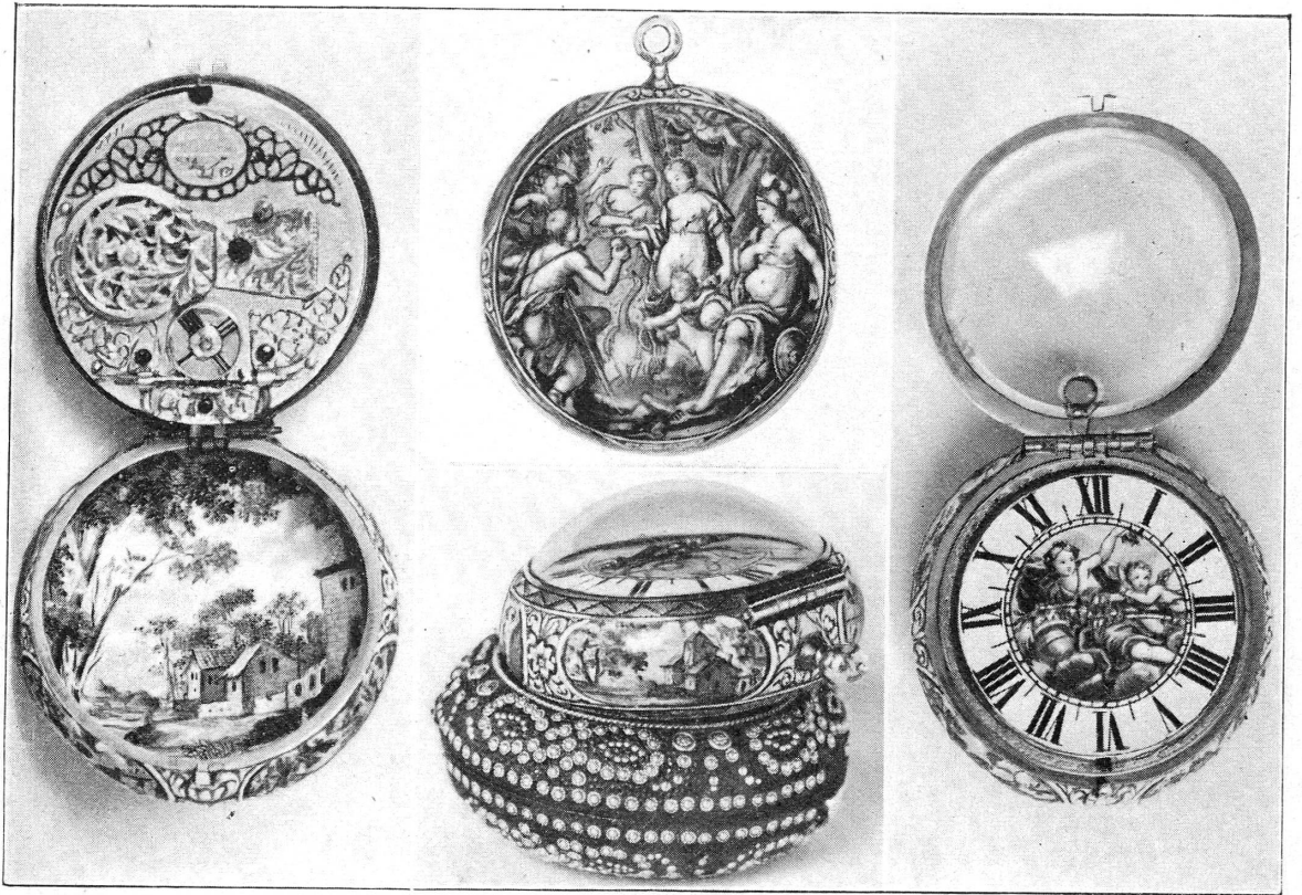
FIG. 2. — Montre signée « Huaud l'aisné », fin du XVII e siècle. Ecole genevoise.