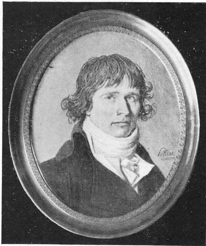
FIG. 4. — Portrait d'homme, époque de la Révolution, miniature sur ivoire, signée Petitot, Ecole française, XVIII e siècle.)

Nous avons gardé pour la fin l'acquisition la plus importante à tous points de vue : celle de la fameuse montre de « HUAUD l'aîné », le plus célèbre des trois frères Huaud, fondateurs de l'industrie genevoise de la peinture en émail sur boîtiers