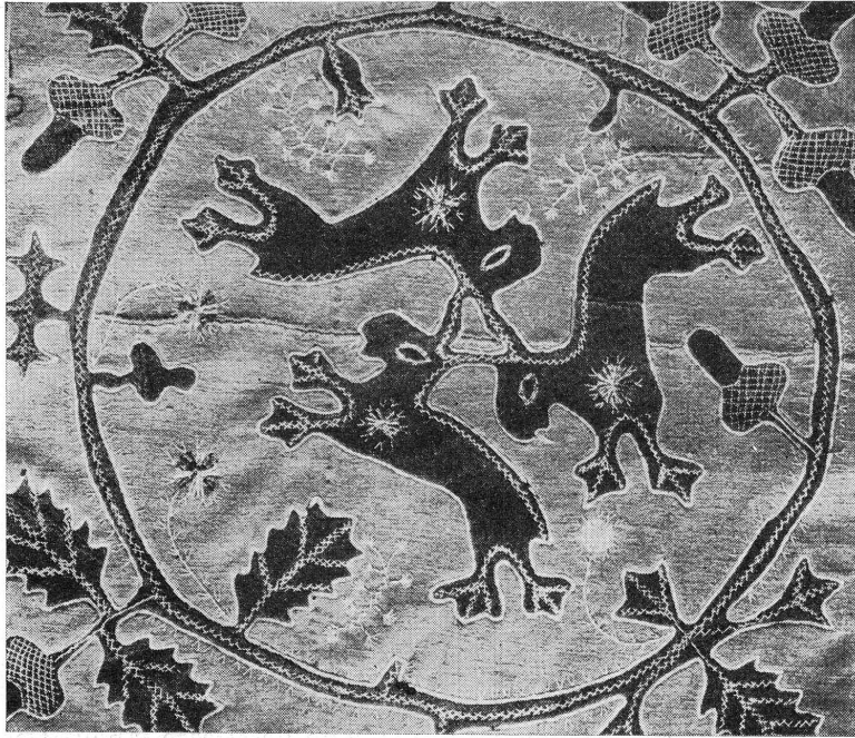
FIG. 3. — Tapis du XVIII e siècle. (Musée d'Art et d'Histoire, n o 5023.)