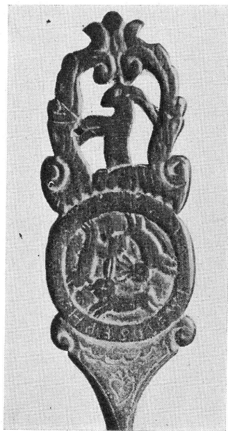
FIG. 4. — Cuiller du XVIII e siècle. (Musée d'Art et d'Histoire, n o 4637.)