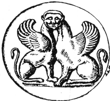
FIG. 2. — Intaille archaïque. (Musée d'Art et d'Histoire, MF. 1535.)

2. MF. 1535. — Sphinx à deux corps et une seule tête . Intaille, époque archaïque (fig. 2).