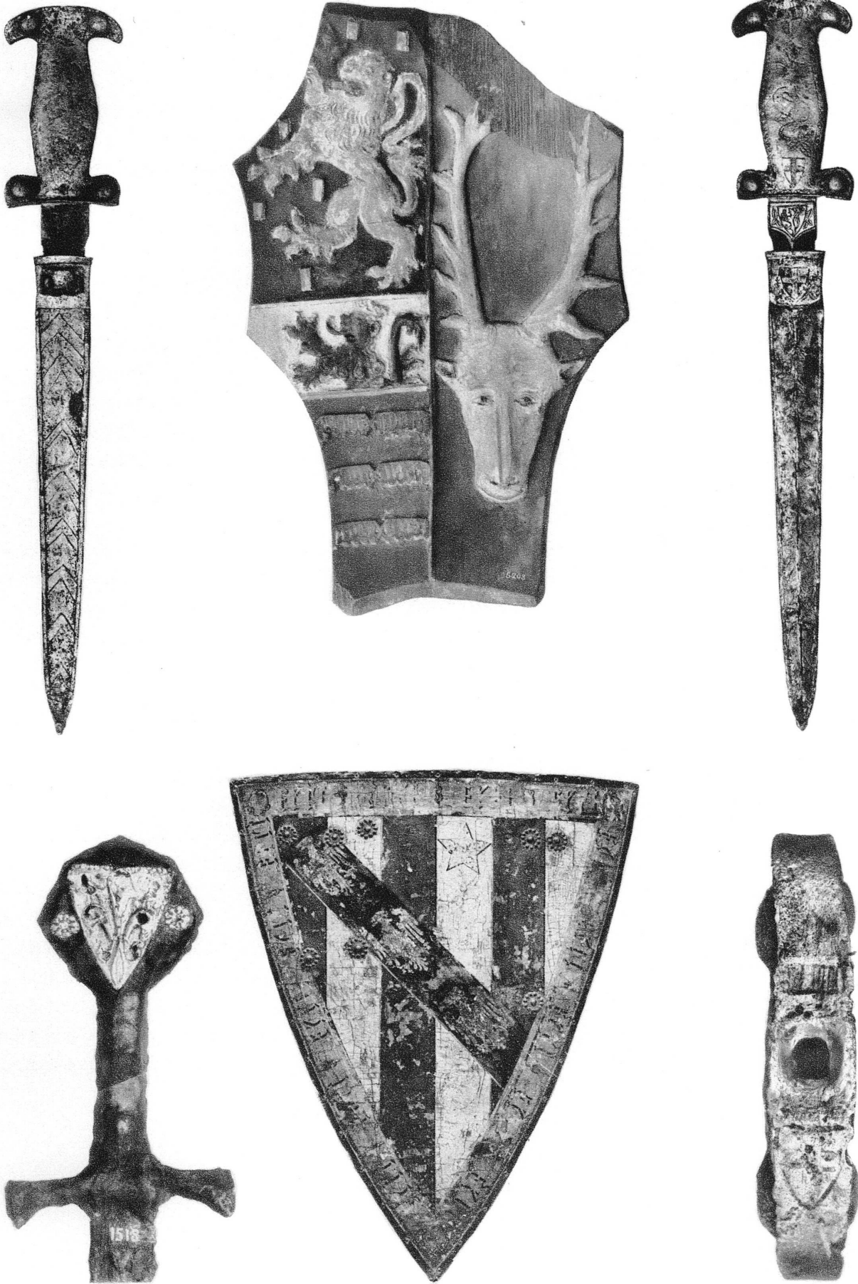
Pl. VIII. — Aux angles: poignard et dague du XVI me siècle, Musée de Genève. — Au milieu, en haut: écusson aux armes des Gingins, Musée de Genève; en bas, targe fausse aux armes de Grandson.