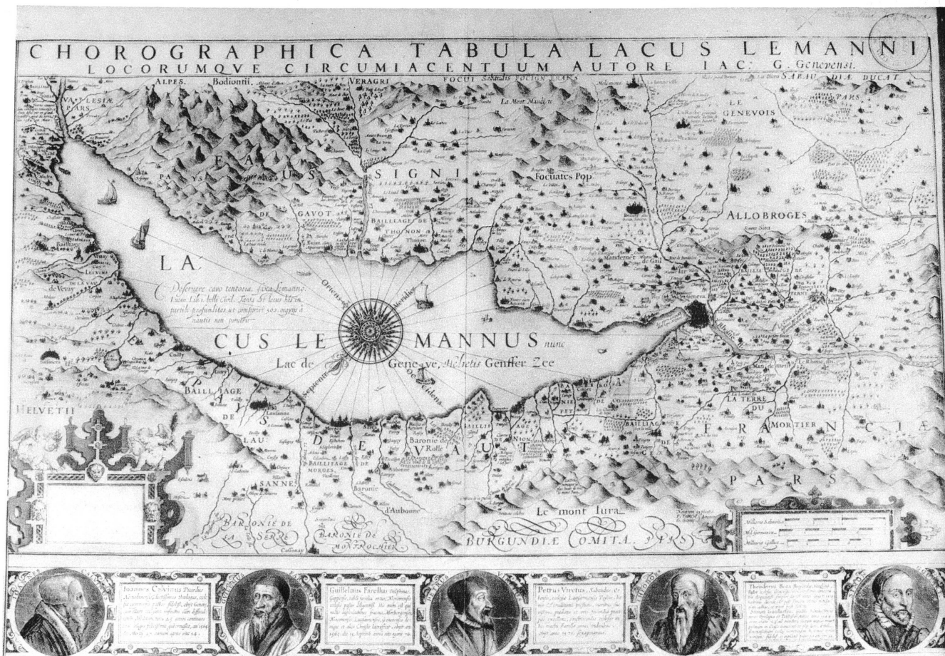
Pl. XX. — Carte du lac Léman, de Jacques Goulart, genevois (1605).