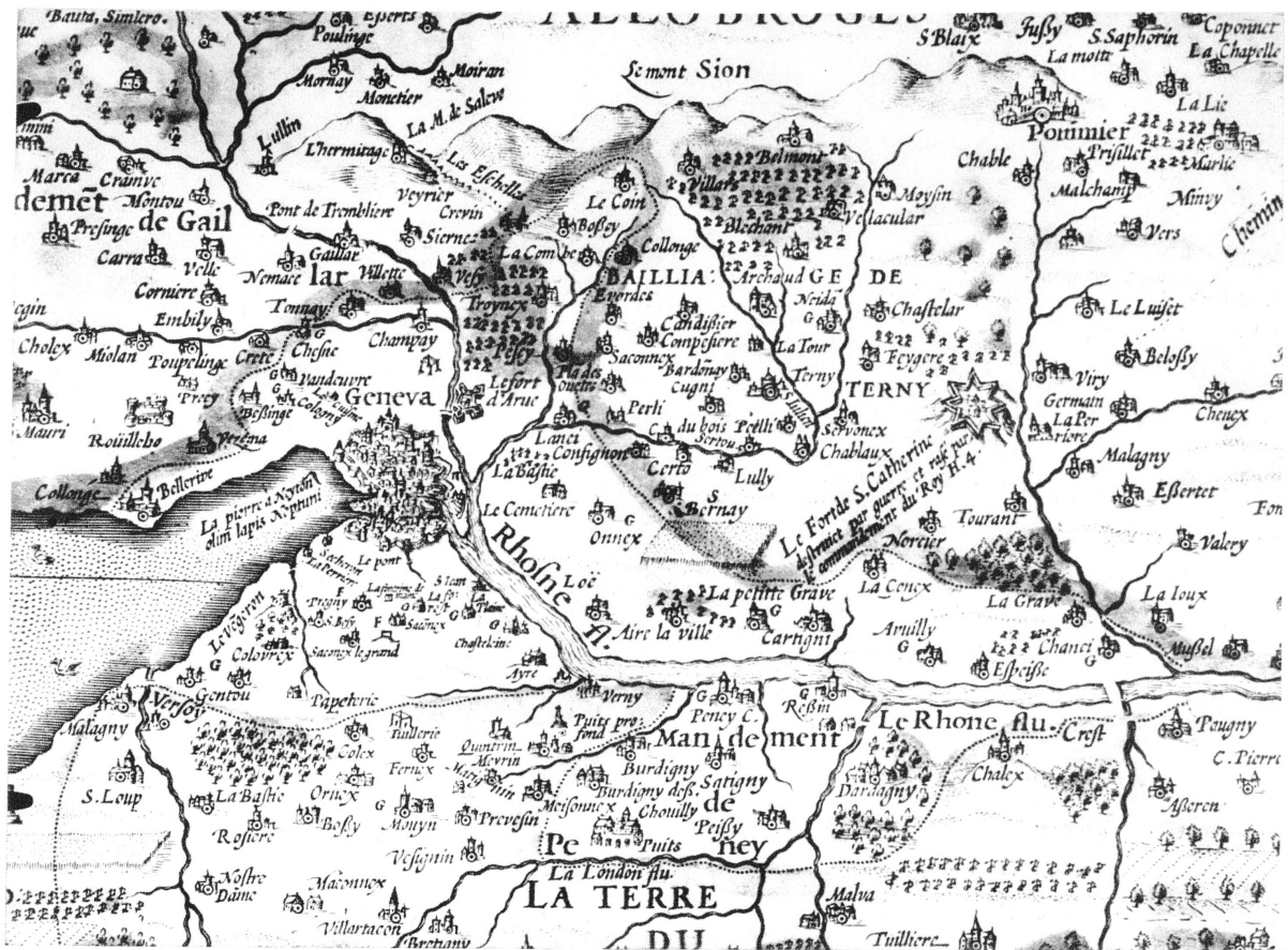
Pl. XXII. — Genève et ses environs en 1605. -- Fragment de la carte de Jacques Goulart.