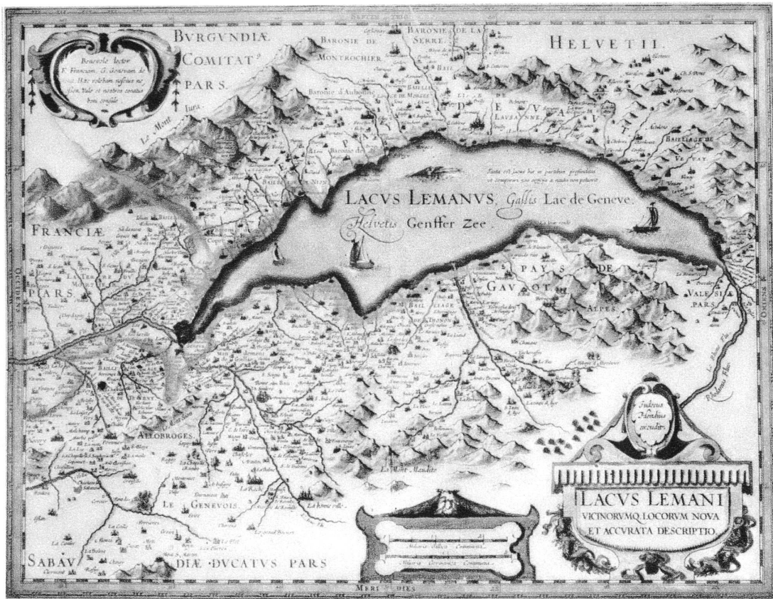
Pl. XXI. — En haut : Carte du lac Léman, de Jean-Baptiste Vriendt (1607). — En bas : Carte du lac Léman, de Josse de Hondt (Judocus Hondius).